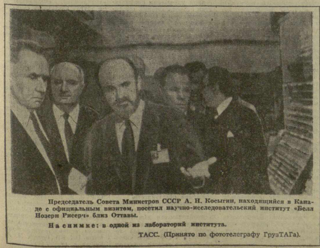
Председатель Совета Министров СССР А. Н. Косыгин, находящийся в Канаде с официальным визитом, посетил научно-исследовательский институт «Келла Носери Гисерчи» близ Оттавы. На снимке: в одной из лабораторий института.