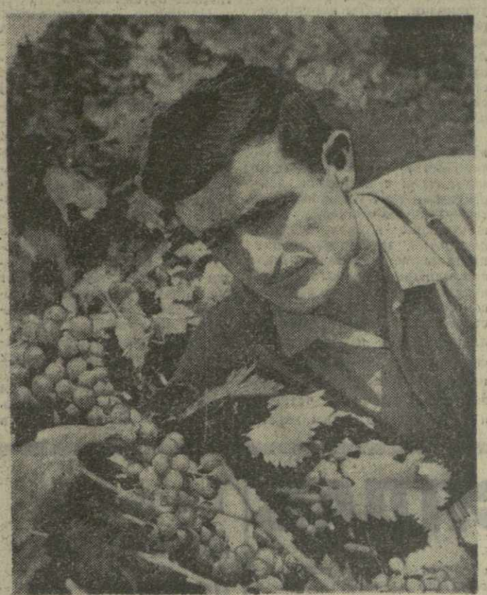
На виноградных плантациях колхозов и совхозов Западной Грузии в разгаре сбор урожая. 13.000 тонн ягод обещают выдать государству виноградары Ванского района. Успешно проходит работа в колхозе села Зендари, где будет собрано 260 тонн янтарных гроздьев. В разгаре уборки урожая в колхозе имени Маркса. В разгаре уборки урожая в колхозе имени Маркса. В разгаре уборки урожая в колхозе имени Маркса. В разгаре уборки урожая в колхозе имени Маркса.

ТРУЖЕНИКИ ПЛАНТАЦИЙ, ВЫШЕ ТЕМПЫ СБОРА ВИНОГРАДА!