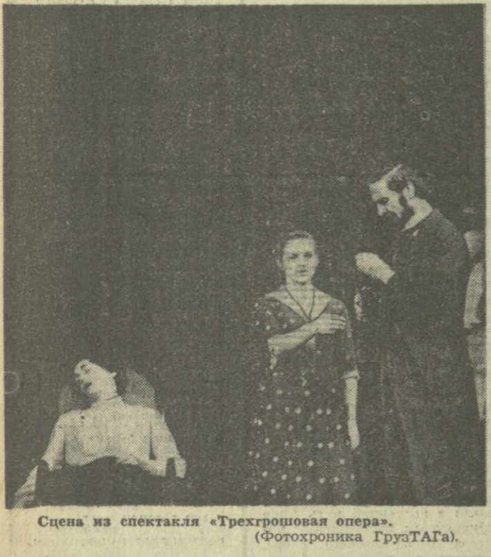
Сцена из спектакля «Трехгрошовая опера».

Брехт хотел научить молодежь правильному отношению к искусству и пониманию его роли в жизни. Он говорил, что «есть тысяча способов выразить правду и тысяча способов ее скрыть».