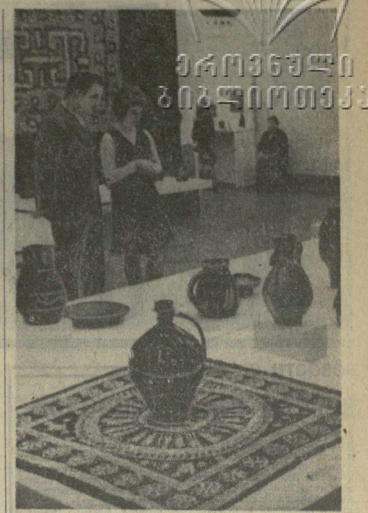
На снимке: итальянские гости в Тбилиси.