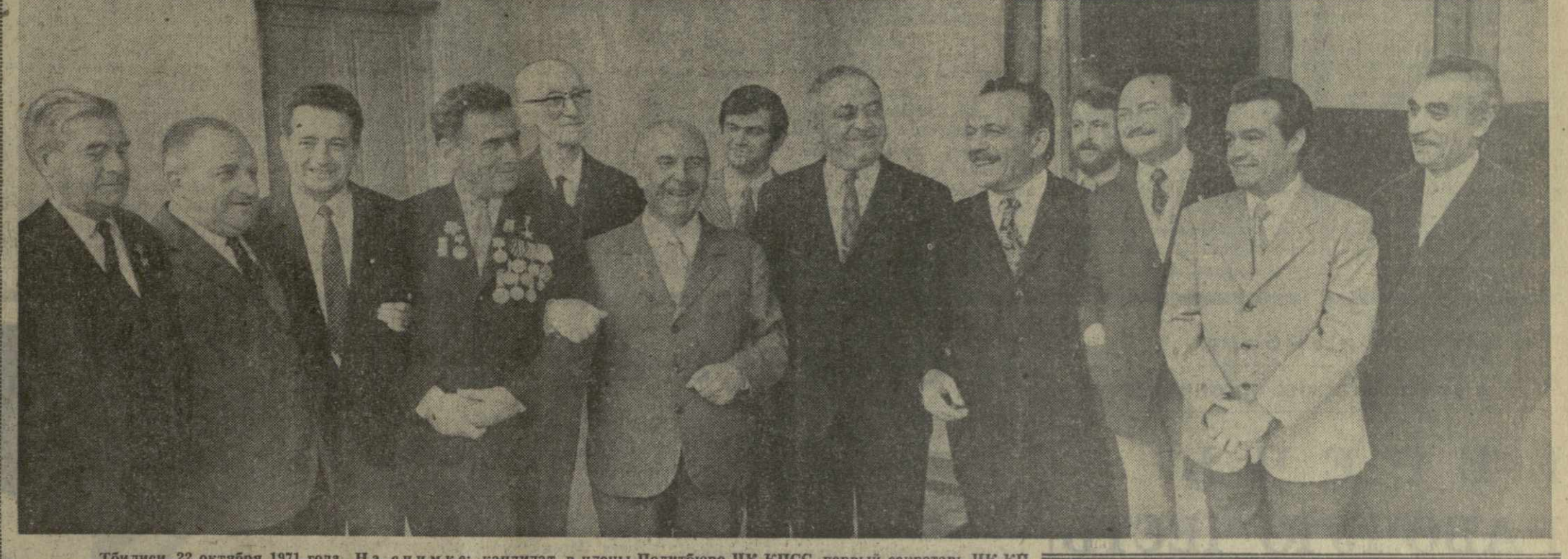
Тбилиси, 22 октября 1971 года. На снимке: кандидат в члены Политбюро ЦК КПСС, первый секретарь ЦК КП Грузии товарищ В. П. Мжаванадзе с группой участников итальянского движения Сопротивления и бывших грузинских партизан.

Прибывшая в Тбилиси группа ветеранов итальянского движения Сопротивления была принята 22 октября в Центральном Комитете Коммунистической партии Грузии.