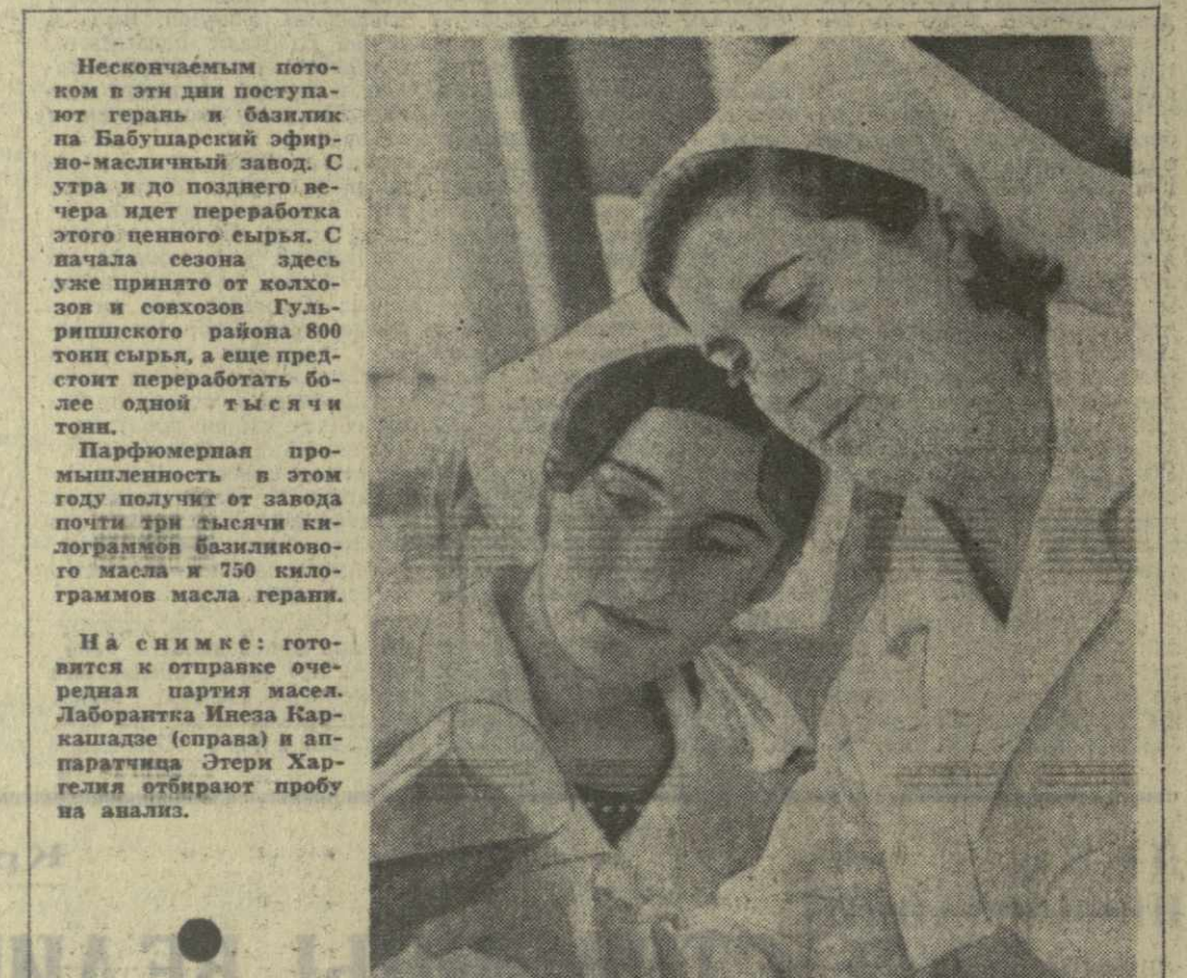
Нескопчёмным потоком в эти дни поступают герань и базилик на Бабушарский эфирно-масличный завод. С утра и до позднего вечера идет переработка этого ценного сырья. С начала сезона здесь уже принято от колхозов и совхозов Гулришского района 800 тонн сырья, а еще предстоит переработать более одной тысячи тонн.

Среди шахтеров Ткибулд немало любителей плавания, регулярно принимающих участие в различных соревнованиях. Но до сих пор местные пловцы не имели хорошей спортивной базы, где можно было бы тренироваться, повышать свое мастерство. Отныне в распоряжении ткибульских шахтеров — новый