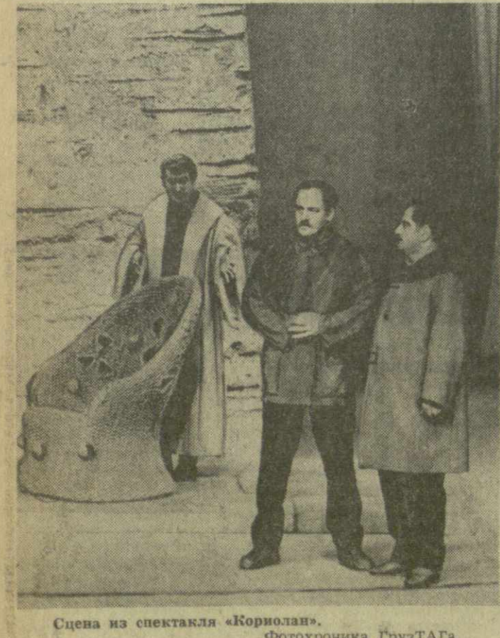
Сцена из спектакля «Кориолан».