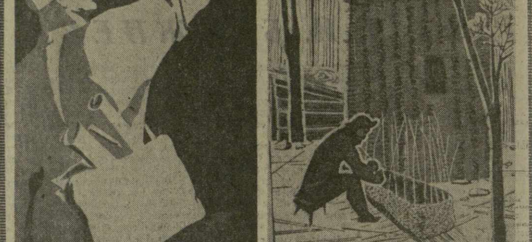
На снимках: плакат художника В. Брискина (слева) и линогравюра художника М. Кивкавадзе из серии «Селение Сакраула».

Праздничная встреча прошла весело и интересно. Была показана композиция на музыку