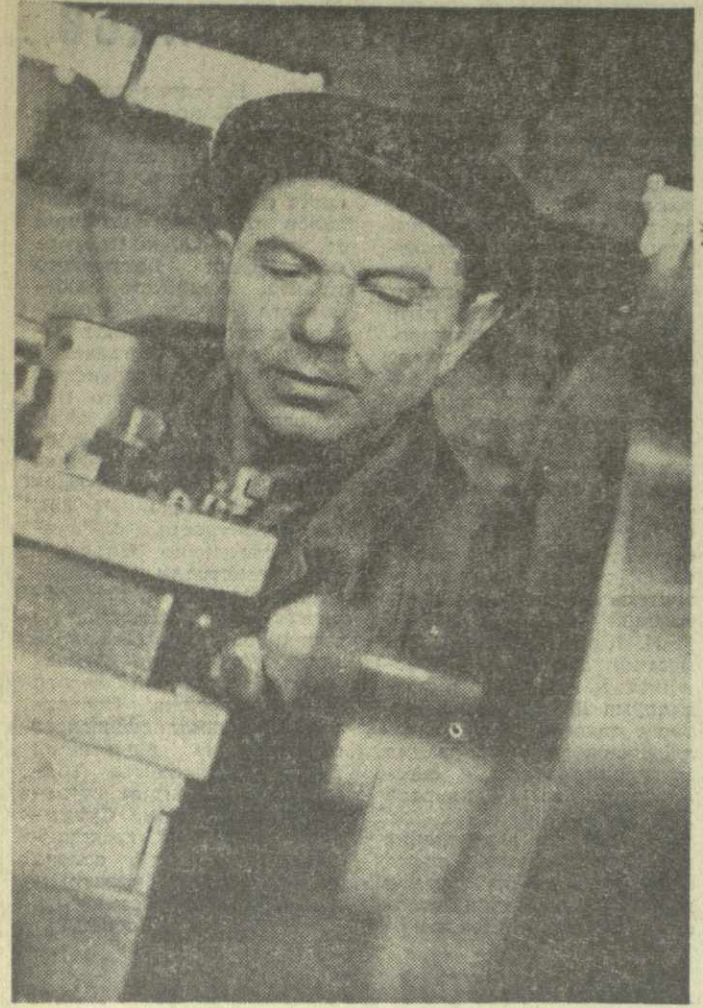
Коллектив Руставского краностроительного завода, успешно завершив план прошлого года, взял новые, повышенные обязательства на второй год пятилетия.