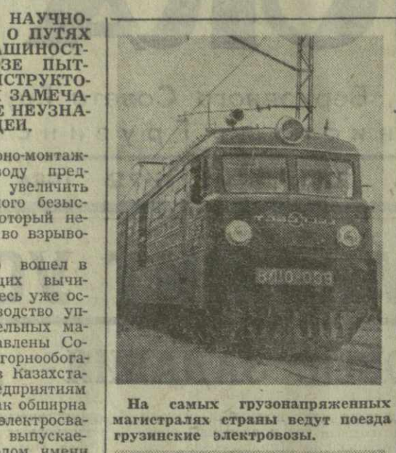
На самых грузонапряженных магистральных станках ведут поезда грузинские электровозы.