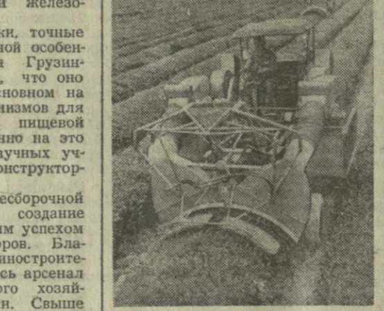
Чаесборочная машина «Сакартело» — верный помощник земледельца.