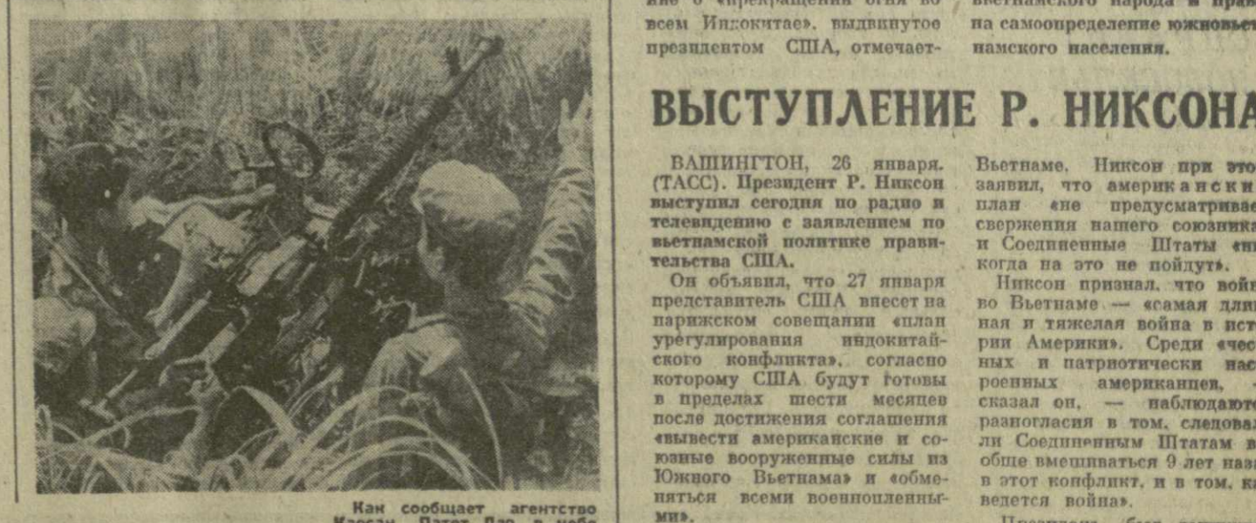
Как сообщает агентство Хаосан Патет Лао, в небе Лаоса, начиная с мая 1964 года, уничтожено в общей сложности 2.256 самолетов США.

СОФИЯ, 27 января. (ТАСС). Состоялось торжественное открытие международной грузовой автомобильной линии София — Москва — София.