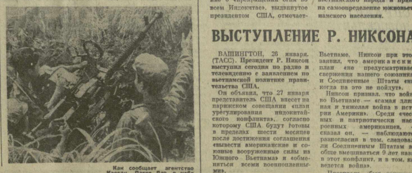
Как сообщает агентство Хаосан Патет Лао, в небе Лаоса, начиная с мая 1964 года, уничтожено в общей сложности 2.256 самолетов США.

В плане, объявленном президентом, нет точной даты полного вывода американских войск из Южного Вьетнама, нет ни слова о готовности США вывести свои вооруженные силы из других стран Индокитая и ответить из всех этого района свои военно-воздушные и военно-морские силы.