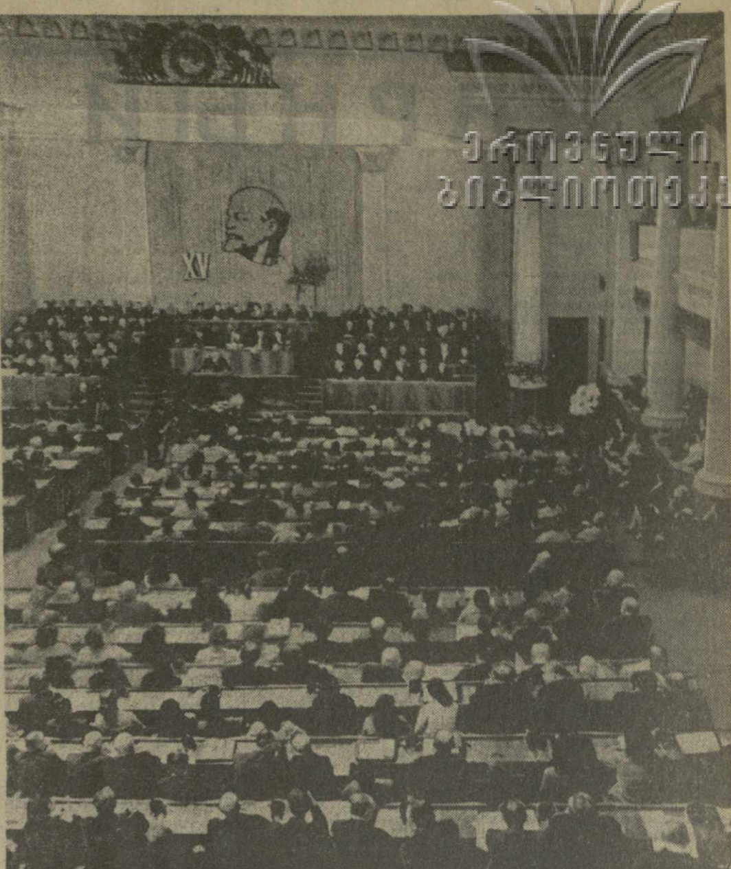
Тбилиси, 28 января 1972 года. XV съезд профсоюзов Грузии. На снимке: в зале заседаний.

Успехи, достигнутые трудящимися Грузии, неотъемлемы от деятельности профсоюзов — самой массовой организации, крупнейшего отряда рабочего класса. Под руководством партийных организаций профсоюзы республики неустанно мобилиуют широкие массы трудящихся на выполнение народнохозяйственных задач, организуют социалистическое соревнование и движение за коммунистическое отношение к труду, постоянно заботятся о дальнейшем усилении коммунистического воспитания людей, улучшении условий труда рабочих и служащих, повышении их благосостояния.