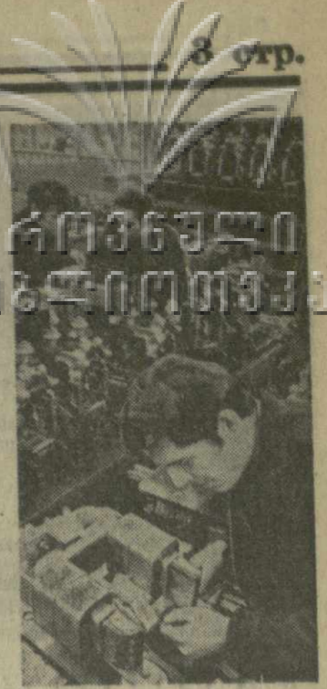
Пятилетку коллектива планировать сообща