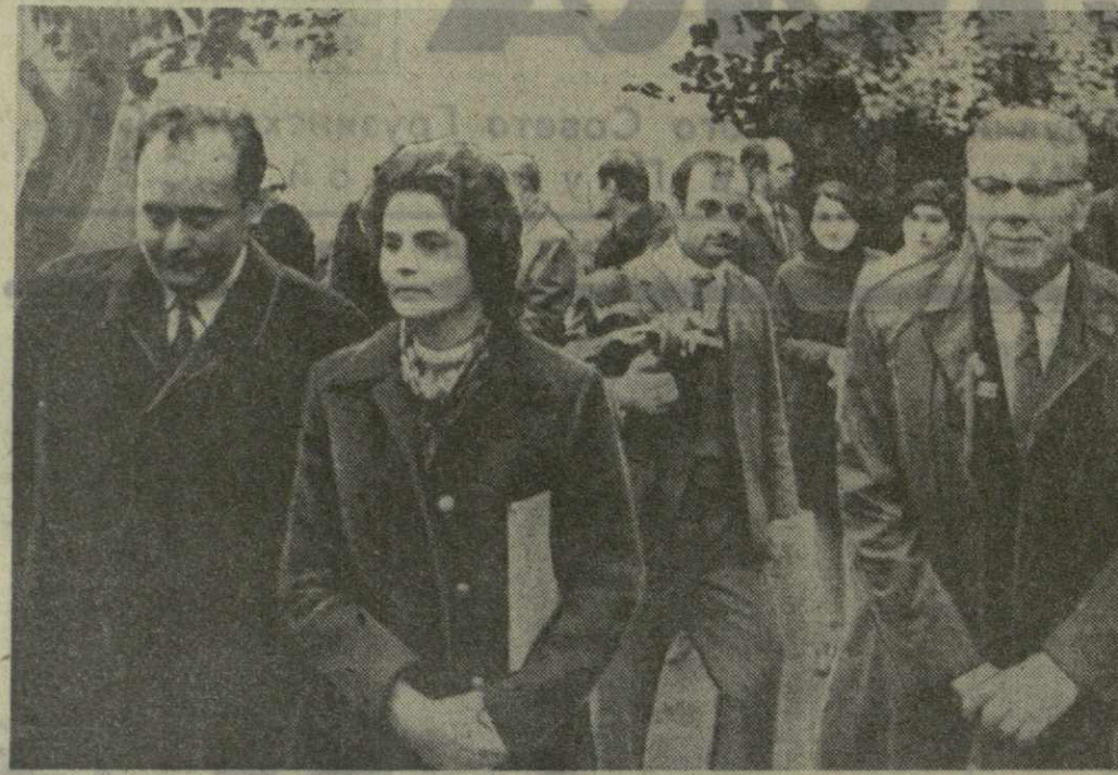
С большим интересом и знакомыми гостями из Эстонии с достопримечательностями республики.

Центральный Комитет Коммунистической партии Грузии, Президиум Верховного Совета и Совет Министров Грузинской ССР устроили в честь участников Дней культуры Эстонии в Грузии прием. (ГрузТАГ).