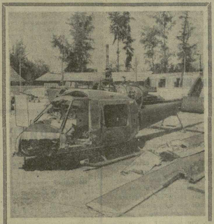
ДРВ. Недавно в Ханое открылась выставка «На фронтах Индокита». На ней представлены многочисленные материалы, рассказывающие о преступной войне США во Вьетнаме и Индокитае. На открытых площадках экспонируются образцы военной техники, которую используют патриоты в боях, трофейное оружие противника. На снимке: американский вертолет, сбитый вьетнамскими патриотами.

ПАРИЖ, 3 ноября. (ТАСС). Сегодня в Елисейском дворце под председательством Президента Ж. Помпиду состоялось заседание Совета Министров Франции. С отчетом о франко-советских переговорах, проведенных на прошлой неделе во время визита Генерального секретаря ЦК КПСС, члена Президиума Верховного Совета СССР Л. И. Брежнев, выступил министр иностранных дел Морис Шуман. Он информировал также о соглашениях, которые были подписаны между Францией и Советским Союзом. Как сообщил журналистам государственный секретарь при Премьер-Министре Лео Амон, выступая на заседании правительства. Президент Ж. Помпиду заявил, что визит Генерального секретаря ЦК КПСС Л. И. Брежнев позволил констатировать «высокий уровень достигнутый франко-советским сотрудничеством». Кроме очень широких перспектив, открытых для двустороннего сотрудничества в экономической, технической и культурной областях, этот визит предоставил возможность для подробного рассмотрения всех крупных современных международных проблем, и в особенности, европейских проблем. Стало ясно, что французская и советская точки зрения близки по многим из этих проблем, касающихся развития политики разрядки и сотрудничества в Европе. Была достигнута договоренность, что оба правительства будут продолжать консультироваться по всем затронутым вопросам.