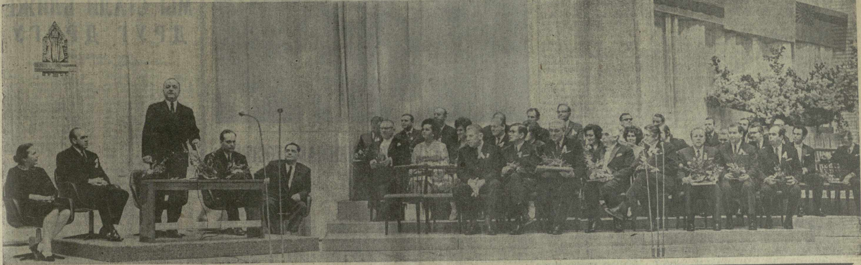
Тбилиси, 4 ноября 1971 года. Торжественное закрытие Дней культуры Эстонии в Грузии. Вступительное слово произносит кандидат в члены Политбюро ЦК КПСС, первый секретарь ЦК КП Грузии товарищ В. П. Мжаванадзе.