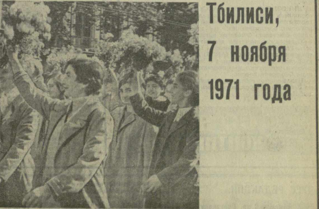
На снимках: на марше — ракетная техника; в праздничных колоннах — счастье юности; демонстрация трудящихся на проспекте Густавели.