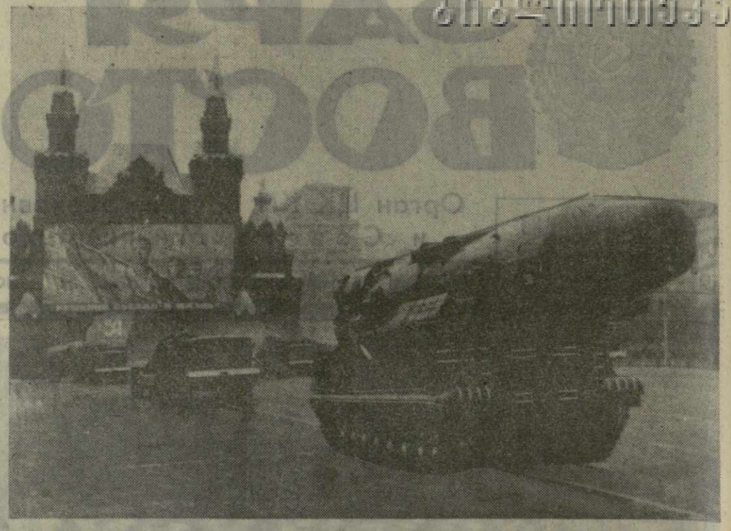
Москва, 7 ноября 1971 г. Военный парад на Красной площади.

В обрамлении хлебных колосьев на Красную площадь вступает колонна Тимирязевского района. Над ней панно со словами: «Повысим роль науки в развитии сельского хозяйства». Шагает Сельскохозяйственная академия имени Тимирязева. Тимирязевцы делом отвечают на призыв партии. В подмосковных совхозах «За-