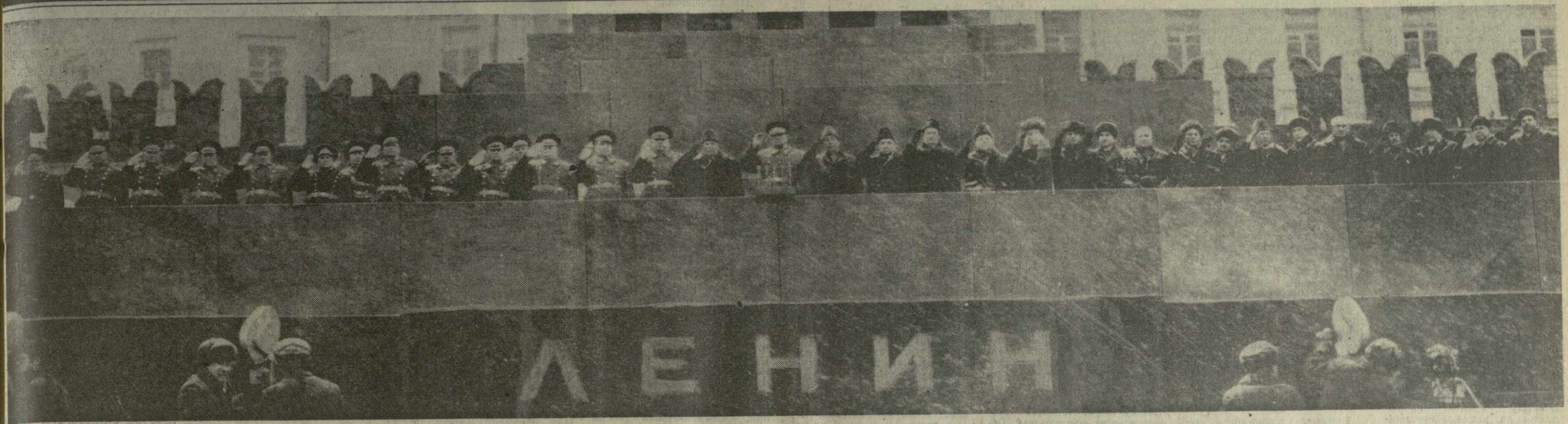
Москва, 7 ноября 1971 года. Красная площадь. Празднование 54-й годовщины Великой Октябрьской социалистической революции. На трибуне Мавзолея В. И. Ленина.

Праздник Великого Октября вылился в яркую демонстрацию нерушимого единства партии и народа, беспредельной преданности советских людей делу Ленина, делу коммунизма. Вместе со всей страной трудящиеся Грузии полны решимости и впредь приумножать завоевания Октября, отдать все силы для успешного решения задач, поставленных XXIV съездом КПСС.