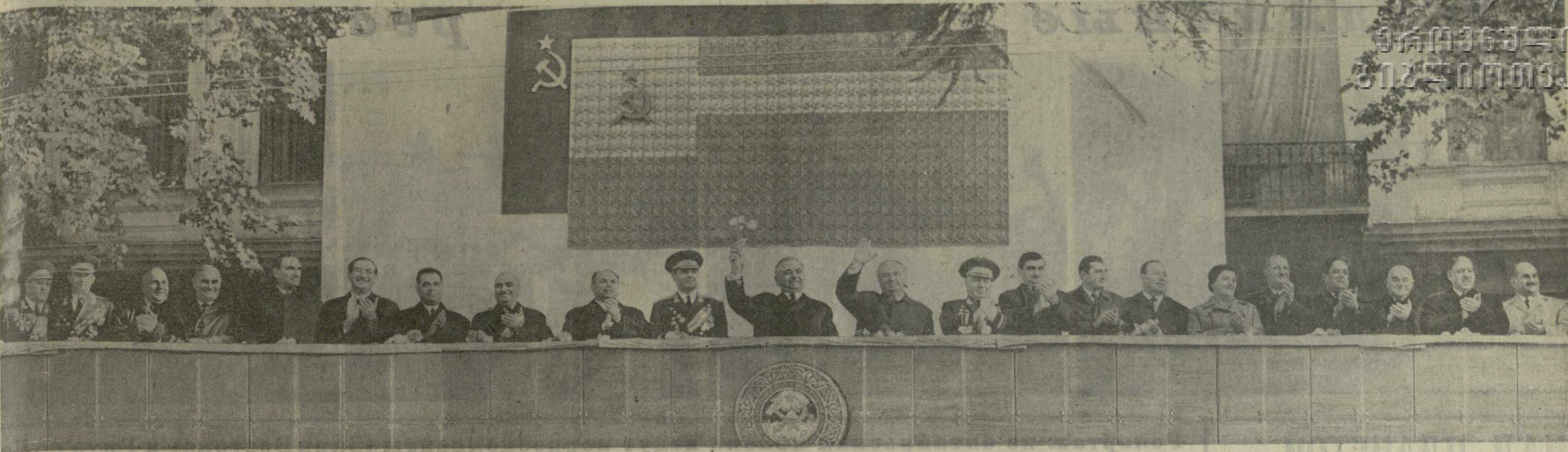
Тбилиси, 7 ноября 1971 года. Празднование 54-й годовщины Великой Октябрьской социалистической революции. На центральной трибуне на проспекте Густавели.