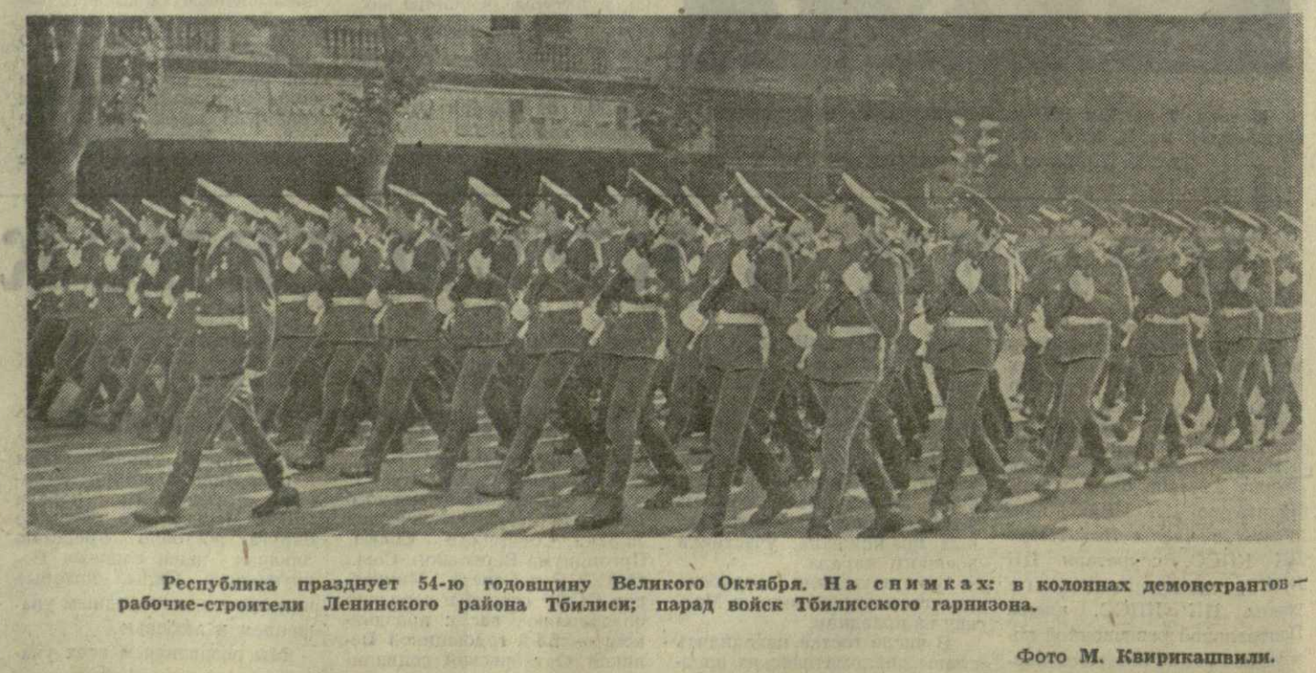
Республика празднует 54-ю годовщину Великого Октября. На снимках: в колоннах демонстрантов — рабочие-строители Ленинского района Тбилиси; парад войск Тбилисского гарнизона.