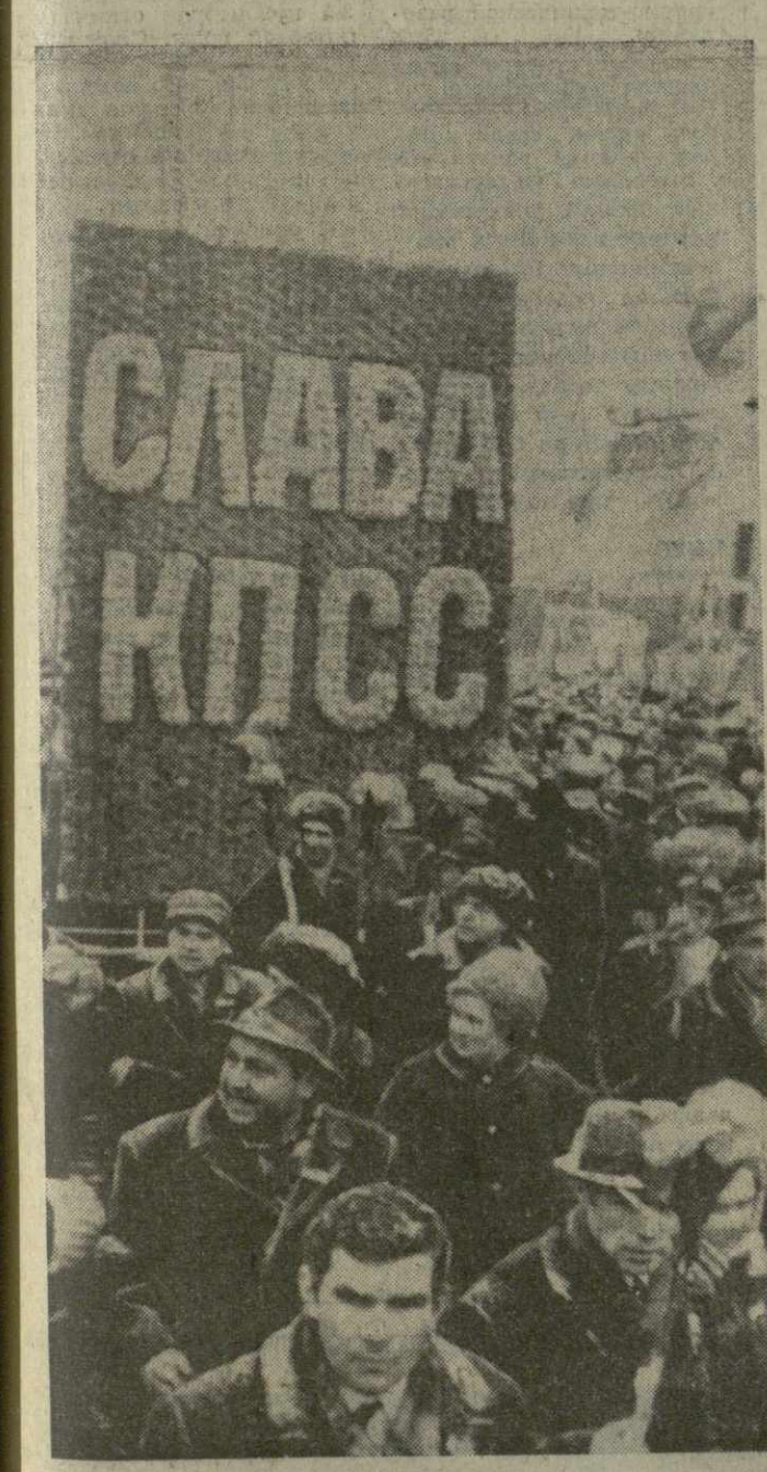
Москва, 7 ноября 1971 г. Демонстрация представителей трудящихся на Красной площади.

Снова на нашу землю пришел в юмаче знамен Октябрь — день рождения Страны Советов. Как всегда, по доброй традиции советские люди встречают этот светлый праздник большими хорошими делами. И как всегда, в такой день сердца она особенно торжественна и народна. Праздничность и торжественность — во всем ее облике: в переливе знамен и гербов союзных республик, в алых флагах, в монументальных панно на зданиях, окружающих площадь. На фасаде ГУМа — портрет, с которого смотрит В. И. Ленин.