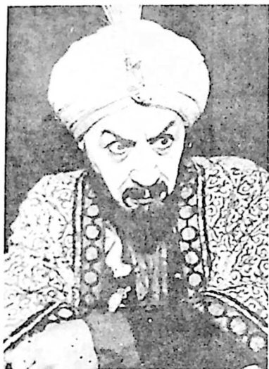
ვახტანგ ჩელთისპირელი ფეიქარ-ხანის როლში