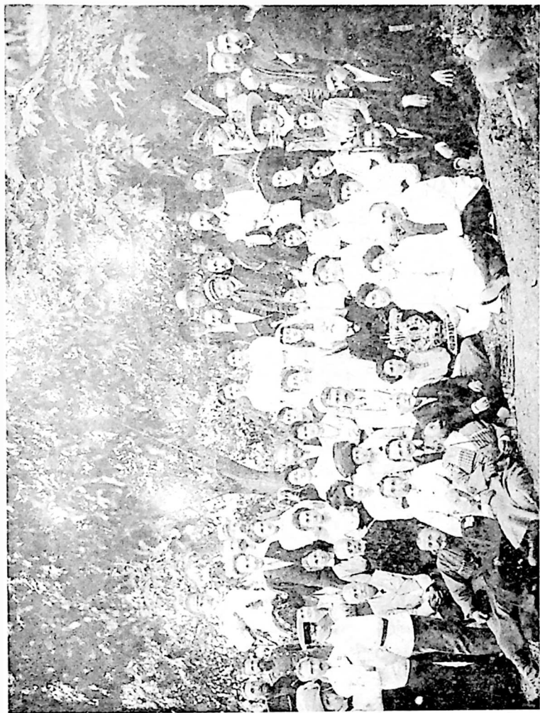
აკაკი წერეთელი თელავში (1911 წ.)