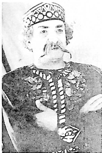
გიორგი მამუჩიშვილი თავად ჯანდიერის როლში