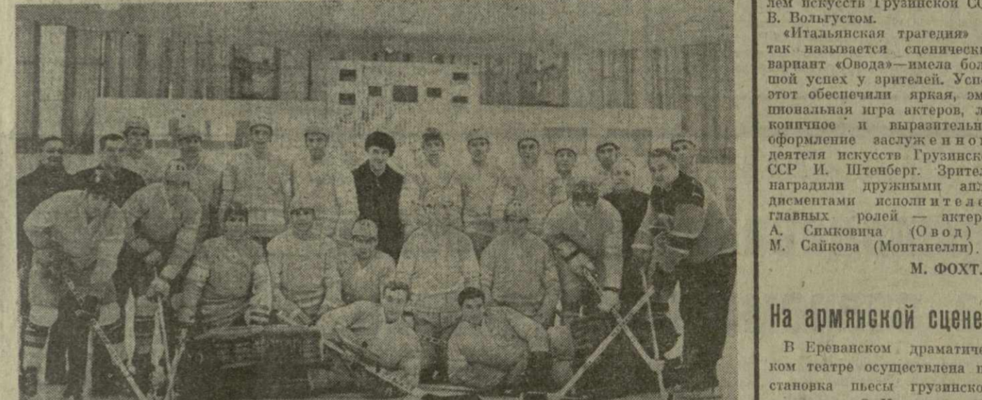
На снимках (сверху вниз): торжественное закрытие XI Белой Олимпиады; советские лыжники Ю. Скобов, В. Веденин, В. Воронков и Ф. Симашов — победители эстафеты 4x10 километров; советская хоккейная команда — победитель олимпийского турнира.