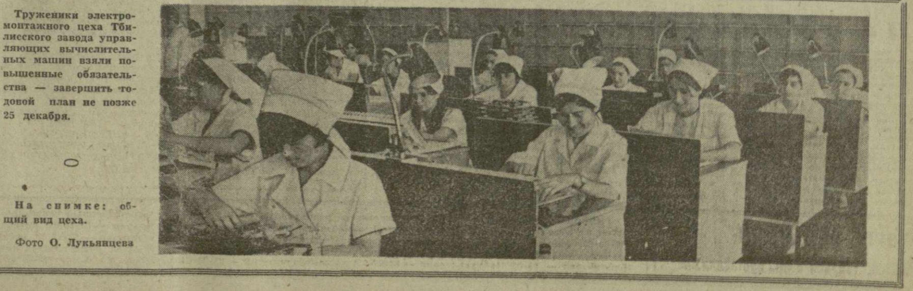
Труженники электромонтажного цеха Тбилисского завода управления вычислительных машин взяли повышенные обязательства — завершить годовой план не позже 25 декабря.

Г. ЦУЛАН, преподаватель математики 55-й средней школы г. Тбилиси.