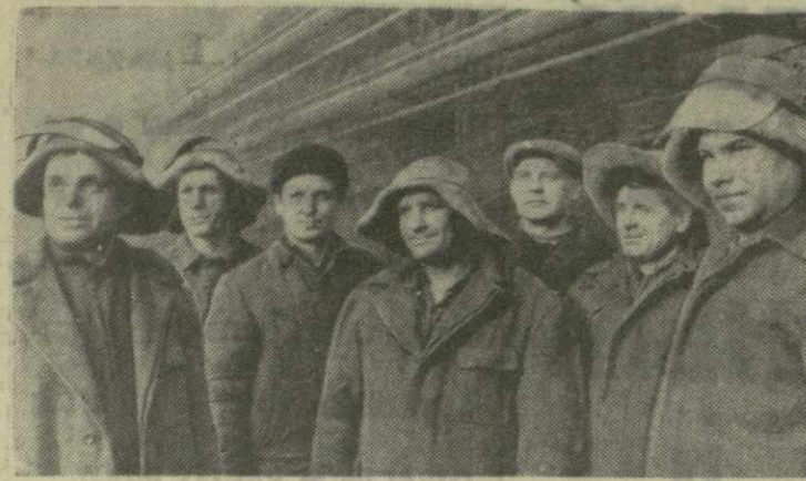
Доменная печь № 4 Донецкого металлургического завода с начала года уже выплавляла более 360 тонн чугуна сверх плана.