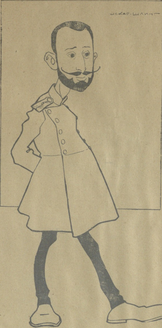
სოფლის „ფუსუნსალა“ ანუ „ქია-ლუა“ ტიტე ართმელაძე.

ტიტე მწერალი. ლიტერატურულ „ფუსუნსალობას“ ანუ „ქია-ლუობას“ ტიტემ