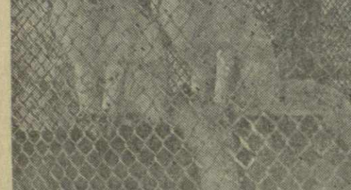
На снимках: неразлучные друзья, Концилмум врач и спаниел Миллик. Лисичкин-естрички.