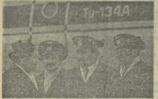
На воздушной трассе Тбилиси — Москва появился новый реактивный самолет „ТУ-134“.

Комментирует это событие заместитель начальника Грузинского управления гражданской авиации по перевозкам и коммерческой эксплуатации Ю. Аваллани: