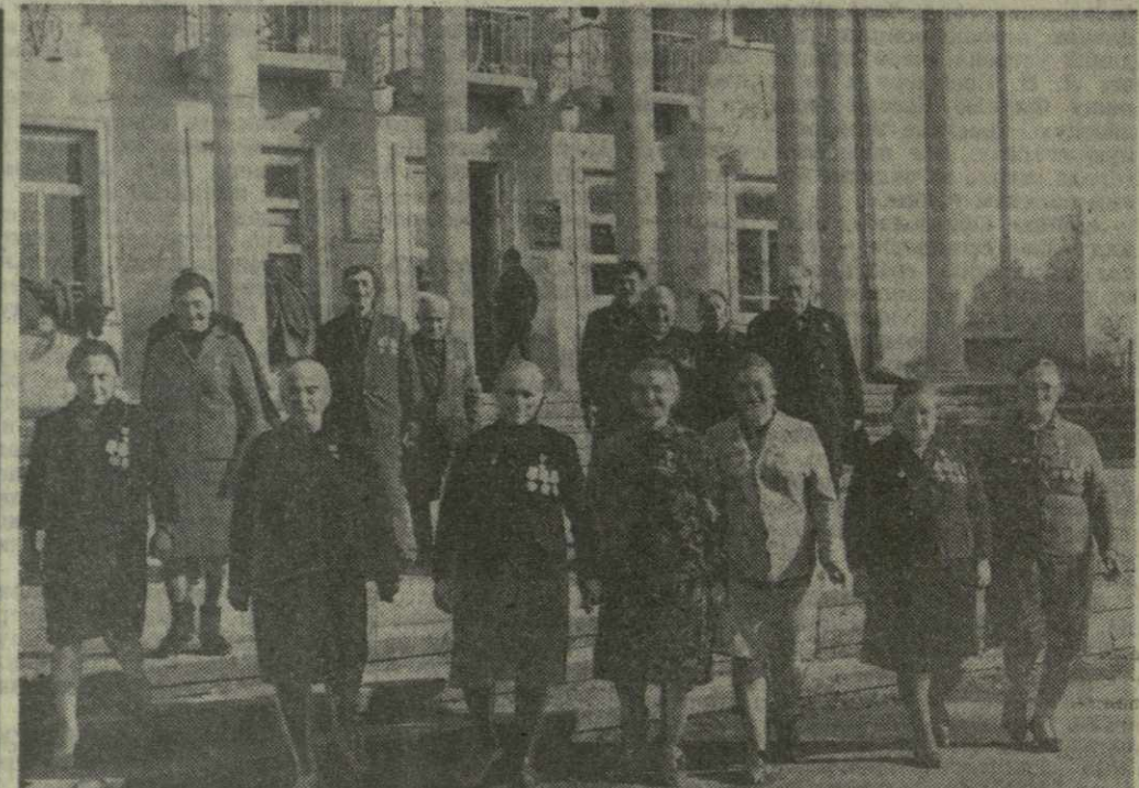
Красным знаменем ЦК КПСС, Совета Министров СССР, ВЦСПС и ЦК ВЛКСМ отмечен самоотверженный труд колхозников села Ахалгопели Зугдидского района по итогам работы в третьем году пятилетия. Государству продано 1.150 тонн сортового чайного листа при плане 900 тонн, с превышением реализованы задания по производству и продаже продуктов животноводства.

Высокие обязательства взяли колхозники на определенную год пятилетия. На снимке: группа передовых колхозников села Ахалгопели.