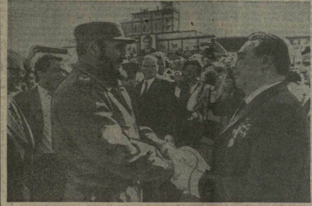
Гавана. 3 февраля Генеральный секретарь ЦК КПСС товарищ Л. И. Брежнев, находившийся в Республике Куба с официальным дружеским визитом, отбыл из Гаваны на Родину. На снимке: во время проводов в аэропорту «Хосе Марти».

3 февраля на площадях и улицах Гаваны, празднично украшенных лозунгами и транспарантами, флагами Советского Союза и Кубы, вновь собрались сотни тысяч трудящихся кубинской столицы. Они пришли поздравить счастливого пути товарищу Л. И. Брежневу, другим советским гостям. На многочисленных транспарантах на русском и испанском языках: «Счастливого возвращения на Родину, Леонид Ильич Брежнев!». На всем пути следования cortege — от резиденции до аэропорта «Хосе Марти» — рабочие, служащие, крестьяне, студенты горячими аплодисментами, здравницами «Вива КПСС!». «Да здравствует братский советский народ — верный друг Кубы!» приветствовали Леонида и Ильяча Брежнева и Фиделя Кастро.