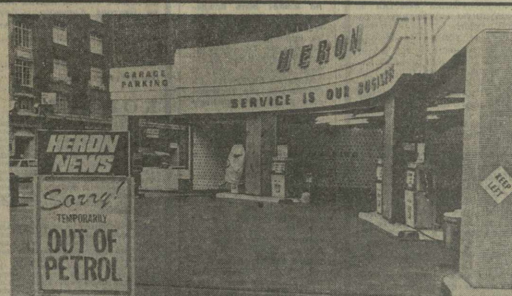
В погоне за наживой нефтяные монополии создают в ряде стран, в том числе и в Англии, искусственную нехватку топлива. Снабжение бензином Лондона фактически парализовано, сотни заправочных станций закрыты. В городе идет настоящая охота за горючим. На снимке: «Бензина нет» — гласит надпись на плакате у этой колонки в Лондоне.

Участники торжественного заседания с большим подъемом приняли приветственное письмо Центральному Комитету КПСС, Президиуму Верховного Совета СССР и Совету Министров СССР. (ТАСС, 4 февраля).