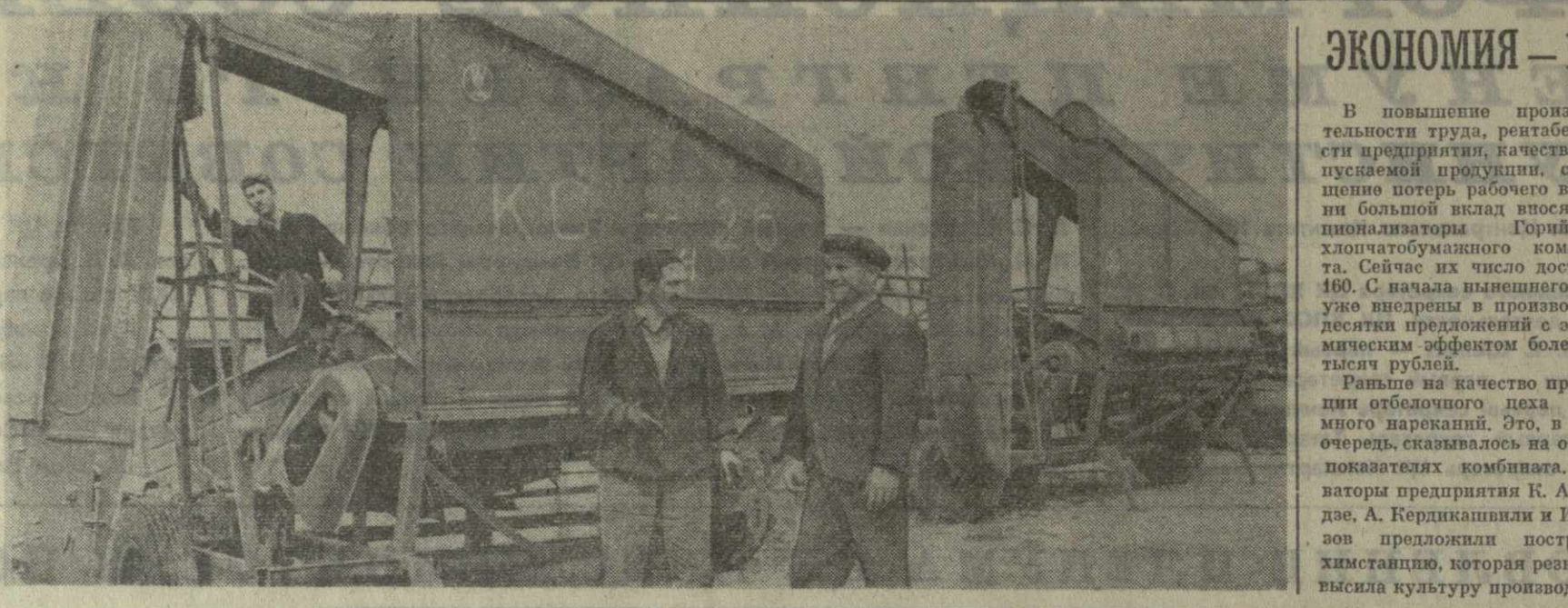
Механизаторы колхоза имени Калинина села Чумлаки Гурджаанского района приступили к ремонту сельскохозяйственной техники и взяли обязательства завершить его досрочно.

Установлен здесь и ленточный транспортер для укладки бутылок в картонные ящики. Это, помимо улучшения качества продукции, высвободило 10 рабочих.