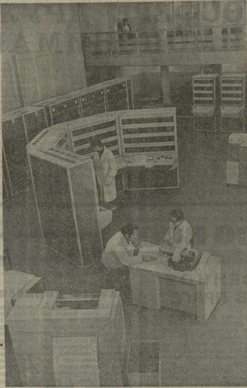
В Научно-исследовательском институте прикладной математики Тбилисского государственного университета в эксплуатацию самая быстрейшая отечественная электронно-вычислительная машина БЭСМ-6. Она производит миллион операций в секунду. На снимке: общий вид электронно-вычислительной машины БЭСМ-6.