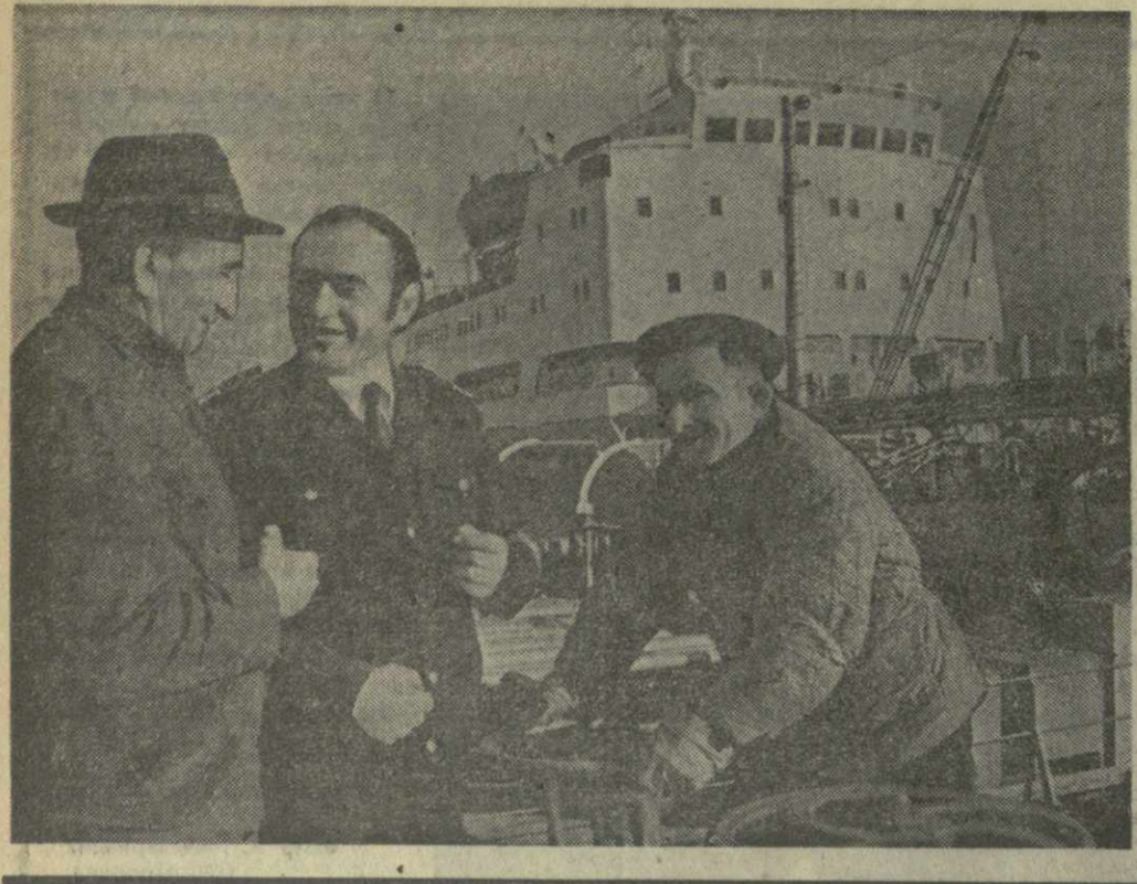
Отцы и сыны верные сыны