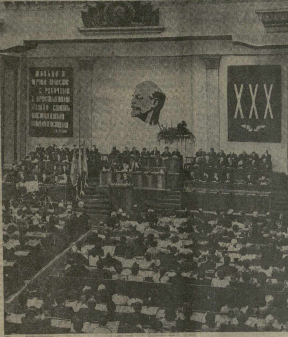
На снимке: в зале заседаний XXX съезда ЛКСМ Грузии.

15 февраля в зале заседаний Верховного Совета Грузинской ССР открылся XXX съезд комсомола Грузии. Под звуки торжественного марша в зал вносят красные знамя Ленинского Коммунистического Союза Молодежи Грузии, памятные знамена ЦК КП Грузии и ЦК ВЛКСМ.