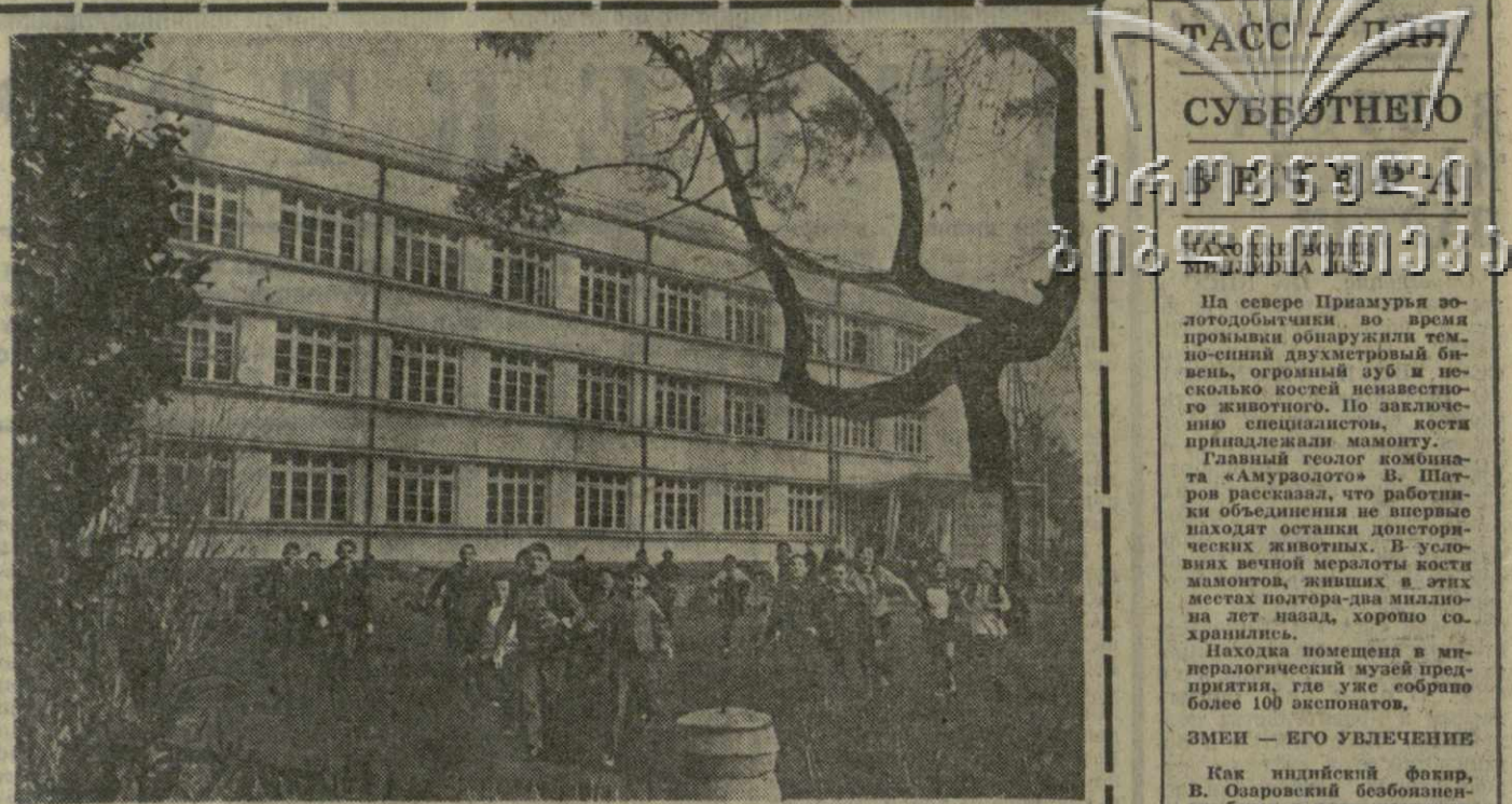
● НА КУРОРТЕ КОБУЛЕТИ у самого берега Черного моря расположена санаторно-лесная школа. Это одна из двух в Грузии школ, где обучаются дети с ослабленным здоровьем.

Многие экспонаты посвящены космической теме, в частности, модель «Лунохода-2».