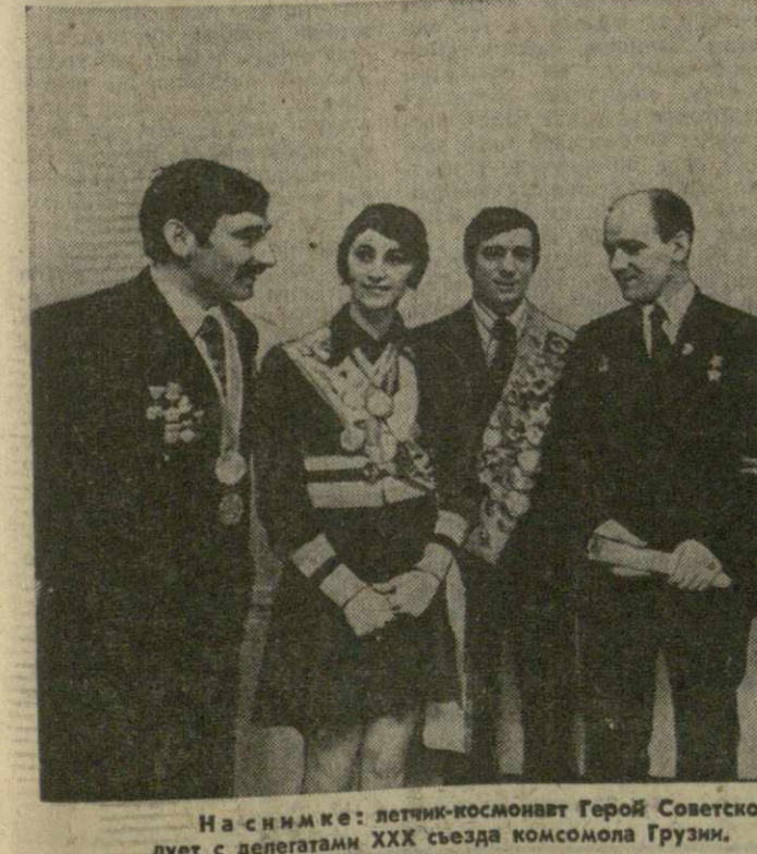
На снимке: лётчик-космонавт Герой Советского Союза М. Рукавишников беседует с делегатами XXX съезда комсомола Грузии.

Делегатов и гостей съезда приветствовали октябрята и пионеры. Съезд продолжает работу.