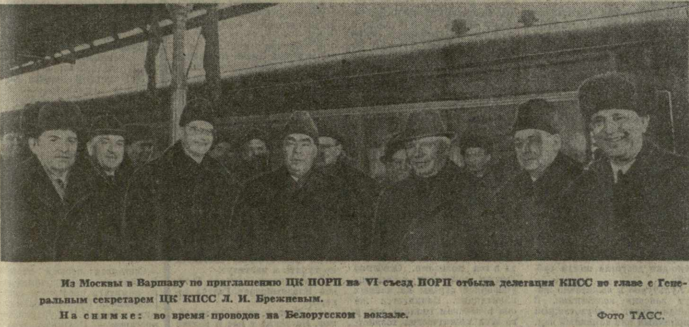
Из Москвы в Варшаву по приглашению ЦК ПОРП на VI съезд ПОРП отбыла делегация КПСС во главе с Генеральным секретарем ЦК КПСС Л. И. Брежневым. На снимке: во время проводов на Белорусском вокзале.

Вместе с А. Н. Косыгиным в Ольборг отбыл Премьер-Министр Дании Е. О. Краг, советские и датские официальные лица.