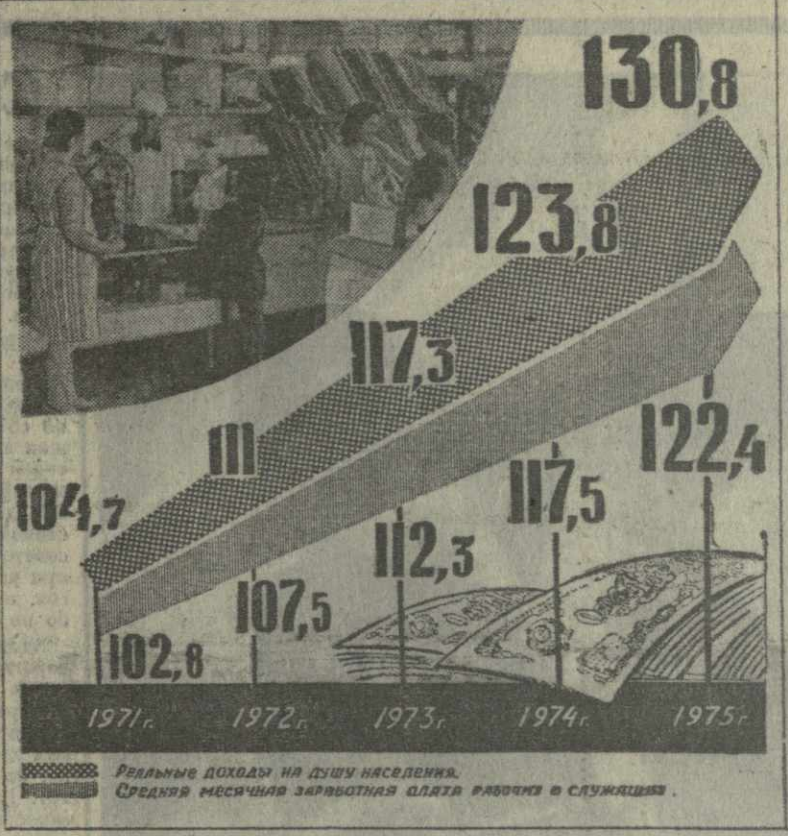
Реальные доходы на душу населения. Средняя месячная заработная плата рабочих и служащих.

НА ДИАГРАММЕ ПОКАЗАНЫ РОСТ В ДЕВЯТОЙ ПЯТИЛЕТКЕ РЕАЛЬНЫХ ДОХОДОВ НА ДУШУ НАСЕЛЕНИЯ И СРЕДНЕЙ МЕСЯЧНОЙ ЗАРАБОТНОЙ ПЛАТЫ РАБОЧИХ И СЛУЖАЩИХ (В ПРОЦЕНТАХ К 1970 ГОДУ).