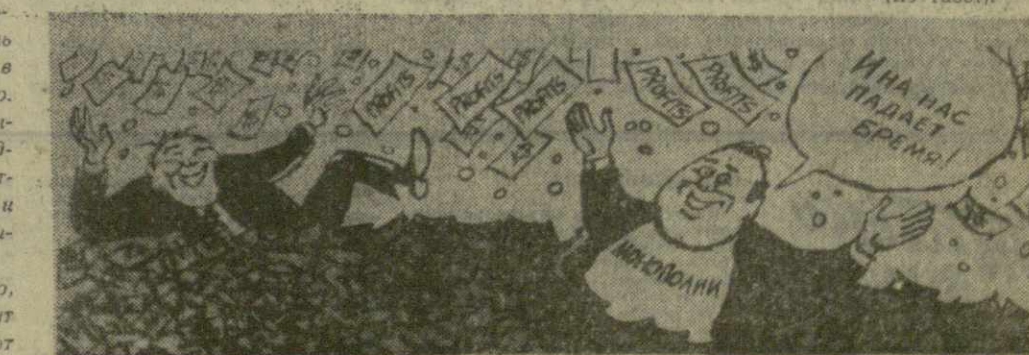
ЖАЛОБЫ БОГАТЕЕВ. Карикатура из газеты «Дейли уорлд».

Экономические санкции, предпринятые с целью спасения положения американского доллара, несут новые тяготы рядовым налогоплательщикам, в то время как крупные монополии продолжают получать баснословные барыши. (Из газет).