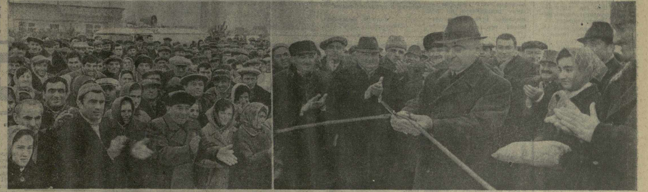
Торжественное открытие Горьской птицефабрики. На снимках: справа — кандидат в члены Политбюро ЦК КПСС, первый секретарь ЦК КП Грузии товарищ В. П. Мжаванадзе перерезает алую ленту у входа на фабрику; слева — строители и представители трудящихся Горьского района на митинге.

Наши пропагандисты, лекторы, поставленные партией на важный участок идеологического фронта, выступают ее боевыми помощниками в борьбе за осуществление решений XXIV съезда КПСС, разработанной им программы экономического и социального развития страны, воспитания нового человека.