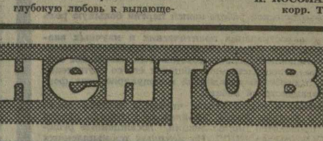
П. КОСОЛАПОВ, корр. ТАСС.

Торжественное заседание открыл выступившим с первым секретарем правления Союза писателей СССР Г. М. Марков. Широко отмечая эту дату, — сказал он, — общественность страны, литераторы и читатели выражают свою глубокую любовь к выдающемуся писателю-коммунисту, общественному деятелю, организатору литературного процесса, борцу, прекрасному человеку, который всю свою жизнь посвятил служению Родине.