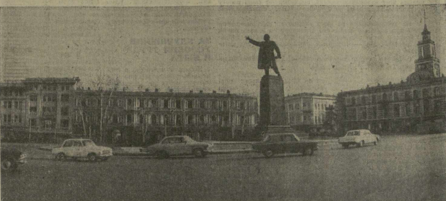
ТБИЛИСИ. Площадь В. И. Ленина.

ЦЕНТРАЛЬНЫЙ КОМИТЕТ КОМПАРТИИ ГРУЗИИ ПРЕЗИДИУМ ВЕРХНЕГО СОВЕТА ГРУЗИНСКОЙ ССР СОВЕТ МИНИСТРОВ ГРУЗИНСКОЙ ССР