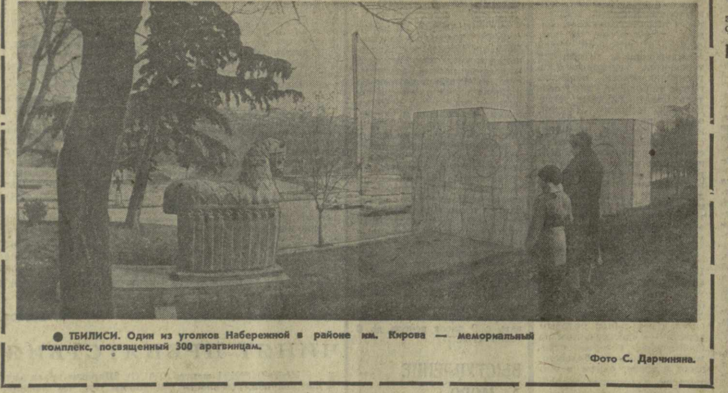
ТБИЛИСИ. Один из уголков набережной в районе м. Кирова — мемориальный комплекс, посвященный 300 армянам.

О дальнейших событиях зритель узнает, когда фильм выйдет на экраны.