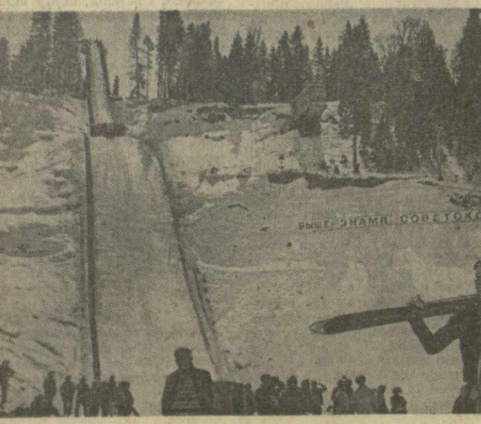
На снимках: сверху — отсюда следят за прыжками с трамплина. Внизу — трамплины готовы к соревнованиям.