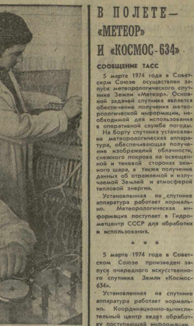
В ПОЛЕТЕ — «МЕТЕОР» И «КОСМОС-634»