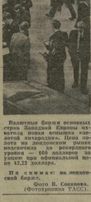
На снимке: на лондонской бирже.

Валютные биржи основных стран Западной Европы охвачены новой волной «золотой лихорадки». Мешающая до недавнего времени подорожанию золота — 160 долларов за унцию при официальной цене 42,22 доллара.