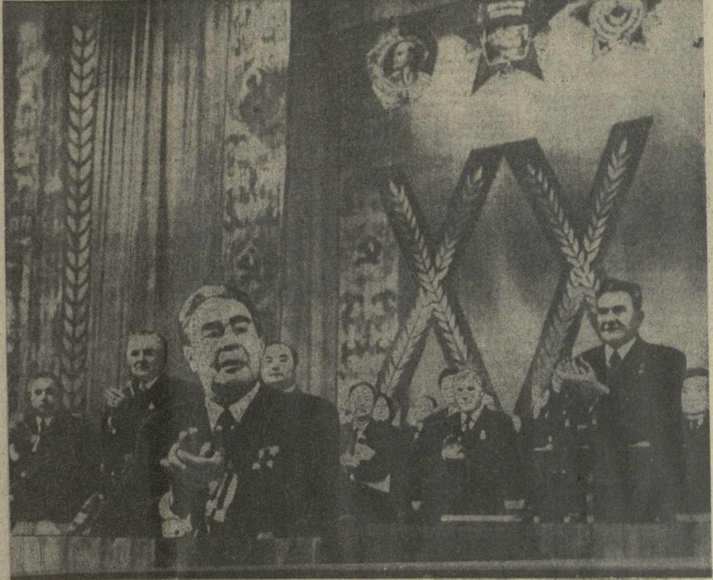
АЛМА-АТА. Торжественное заседание, посвященное 20-летию освоения целины. На сцене — во время торжественного заседания.

Центральный Комитет КПСС, Президиум Верховного Совета СССР и Совет Министров СССР выражают твердую уверенность, что трудящиеся целинных районов будут с еще большей активностью и настойчивостью бо- роться за осуществление решений XXIV съез- да КПСС и добьются крупных успехов в даль- нейшем развитии сельского хозяйства.