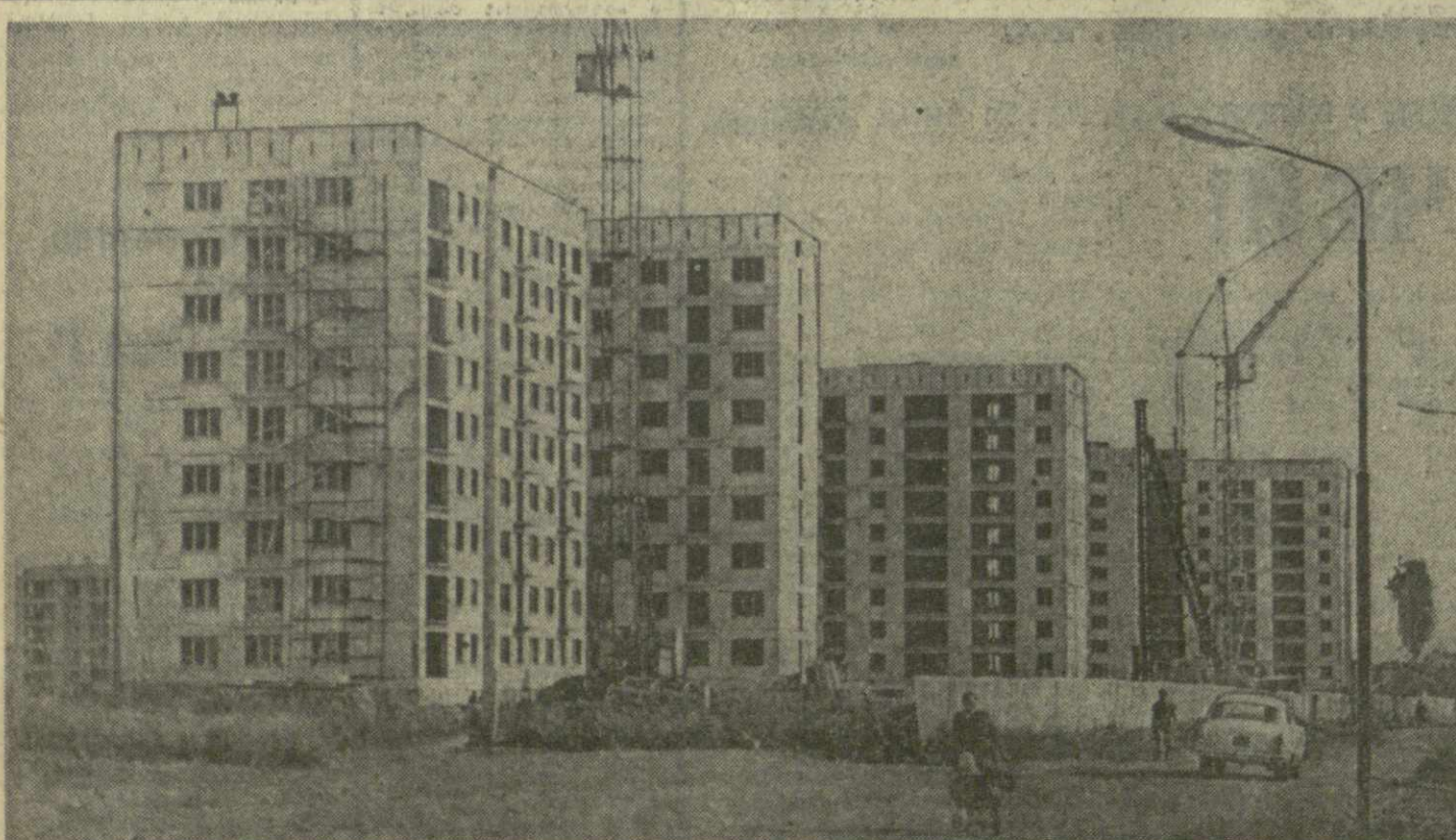
● СТРОИТЕЛЬСТВО ВЫСОТЫХ ЖИЛЫХ ДОМОВ на улице имени Церетели в Тбиси.