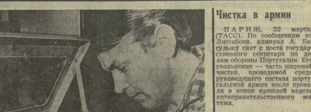
Чистка в армии

Поставки оружия за границу, объем которых в прошлом году достиг почти 10 млрд. долларов, чревата опасностью, подчеркнул сенатор. Они оказывают отрицательное влияние на внутреннюю жизнь США: истощают и без того ограниченные запасы такого сырья, как железо, уголь и нефть, лишает США финансовых ресурсов, которые могли бы быть использованы для решения проблем страны.