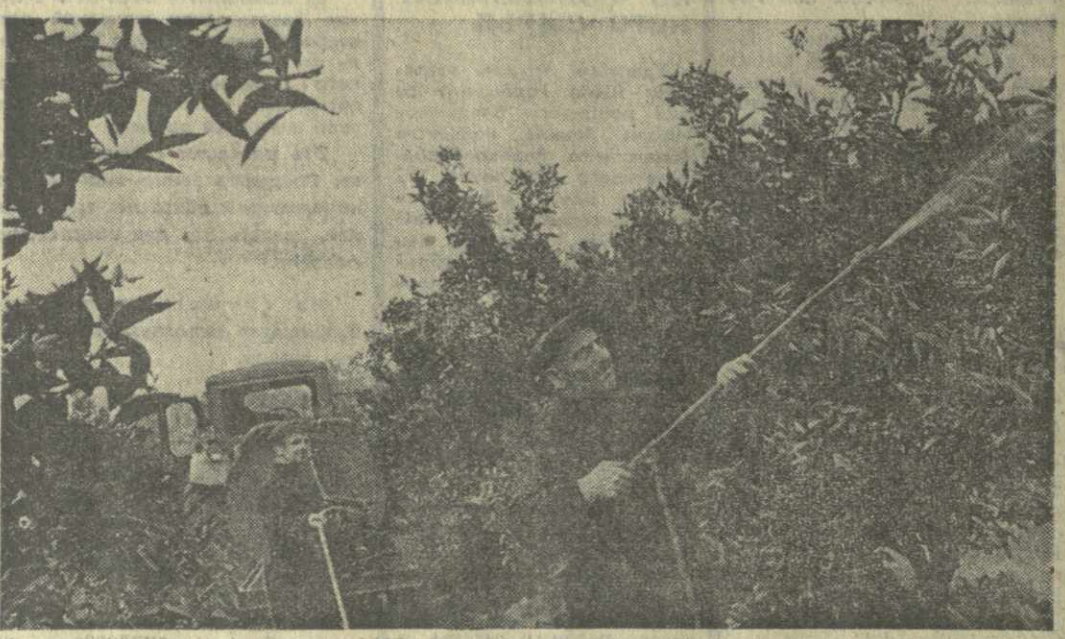
На плантациях Хелвачаурского района проводится весеннее лечение цитрусовых насаждений.

В колхозе поселка Хелвачаури работы по опрыскиванию цитрусовых деревьев уже проведены на площади в 15 гектаров. Механизаторы объявляют закончить комплекс работ по лечению садов на 10 дней раньше срока.