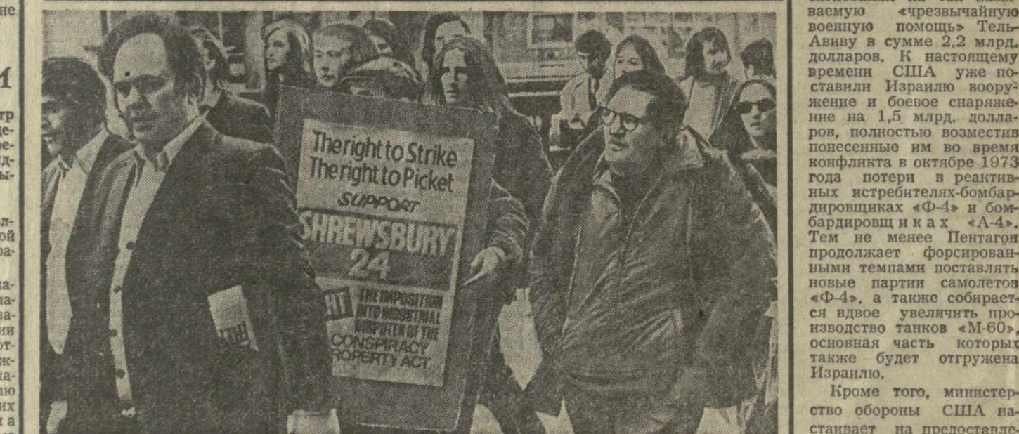
АНГЛИЯ. В Лондоне состоялась демонстрация протеста против преследований рабочих-строителей города Шрусбери, которые участвовали в забастовочных пикетах. Шесть строителей приговорены к тюремному заключению на различные сроки за «заговорщическую деятельность», даже несколько рабочих грозит судебная расправа. В демонстрации приняли участие тысячи англичан из разных районов страны, представляющие различные политические партии и профсоюзы. На снимке: во время демонстрации.

Кроме того, министерство обороны США настаивает на предоставлении Тель-Авиву на крайне льготных условиях долгосрочных займов на сумму 700 млн. долларов с целью закупки новых партий вооружения.