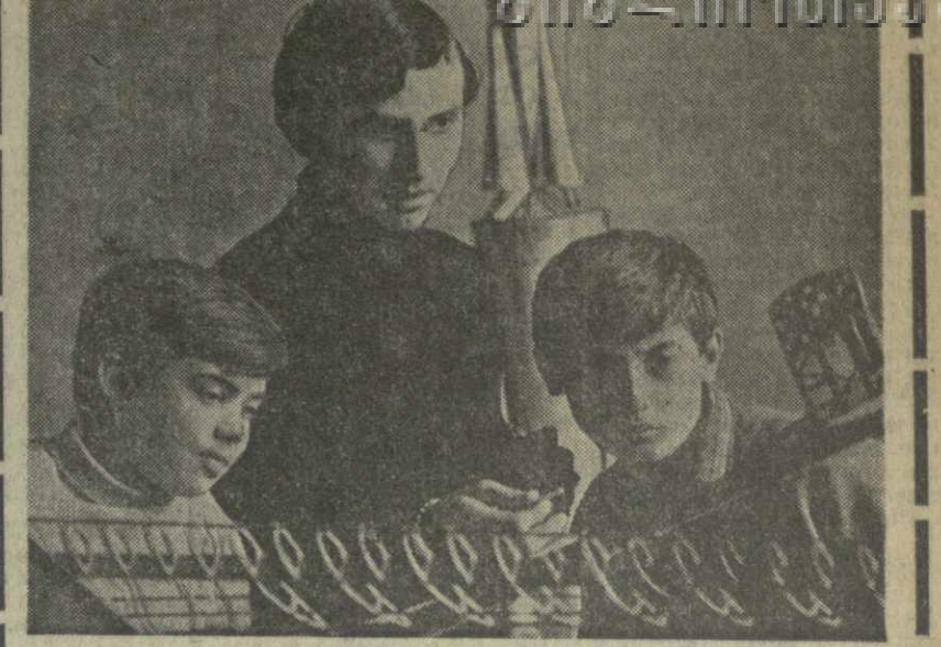
До 1.500 учащихся школ города Тбилиси объединены в ста различных экспериментальных, технических и научно-технических кружков Центральной станции юных техников. К услугам ребят — многочисленные лаборатории и кабинеты, оснащенные новейшими приборами и аппаратами. Опытные педагоги прививают учащимся любовь к технике, развивают их способности и склонность к творческой работе, что в конечном итоге помогает ребятам создавать полезную для школы различную продукцию. Члены кружков конструируют полезные для школ различные приборы и пособия, изучают историю развития техники и ее прогресс в наши дни, посещают лекции на научно-технические темы, встречаются с передовиками производства, ведущими специалистами научных учреждений. На снимке: аэромодельная лаборатория. Руководитель — студент-электрик Г.М. Гриненко занимается со школьниками Т. Ломатадзе и Б. Арчамазашвили.

хозных откормочных пунктах в таких относительно благоприятных с точки зрения развития животноводства районах, как Хулоский и Шуахеский. Одним из основных показателей дальнейшего развития колхозного производства, снижения себестоимости продукции является оптимальное соотношение роста производительности труда и его оплаты. Однако в колхозах республики в 1972 году по сравнению с 1968 годом производительность труда повысилась на 8,1 процента, а оплата труда — на 17,3 процента. Руководители многих колхозов безответственно относятся к общественным средствам и имуществу. Необоснованно списывают технику, инвентарь и даже многолетние насаждения. Неправильно расходуют недельный фонд. Реальные возможности повышения производительности труда и снижения себестоимости продукции имеют колхозы сел Хулоского, Чансубани, Дага Кобулетского района, Ахашени Хелвачаурского района и др. Важно, чтобы руководители этих хозяйств больше внимания уделяли эффективному использованию резервов, экономному и бережливому расходованию общественных средств, четко наладили учет и отчетность. ЦК КПСС в своем Обращении к партии, к советскому народу призвал работников всех отраслей народного хозяйства сосредоточить особое внимание на ускорении роста производительности труда. Долг сельских труженников Аджарии — делом ответить на призыв партии.