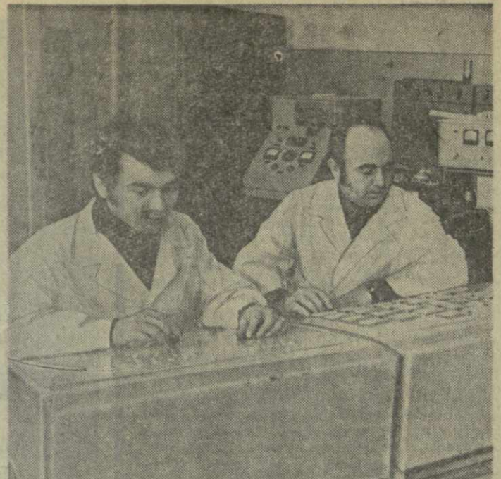
СОТРУДНИКИ Горьковского научно-исследовательского института автоматизации производственных процессов в промышленности завершили работу по созданию опытного образца электронной системы для автоматического взвешивания зеленого чайного листа.

Мальчики и девочки, достигшие 10-летнего возраста, после трехлетнего обучения в общеобразовательной школе могут поступить в Тбилисское хореографическое училище. Дети успешно сдавшие экзамены, зачисляются в училище в первый класс по специальности в четвертый — по общеобразовательным предметам. Зачисления по приему в училище принимаются с мая, экзамены начинаются в июне. Училище интернатом не располагает.