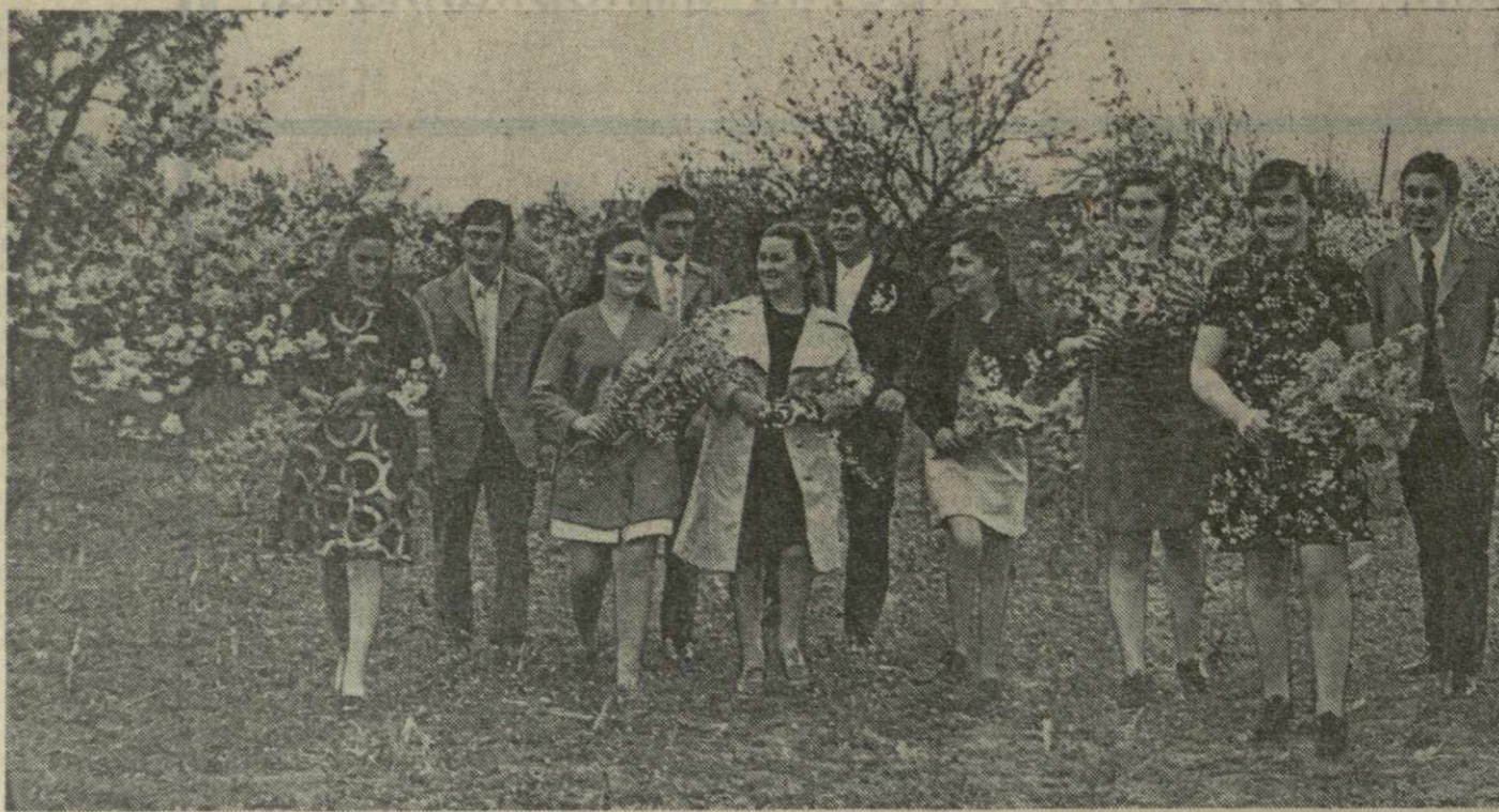
ВЕСНА! Это буйная белоснежная юность садов, это радостный смех, улыбка и надежда молодых. Хорошо, когда приходит весна. На снимке: группа молодежи села Днгоми Мцхетского района.