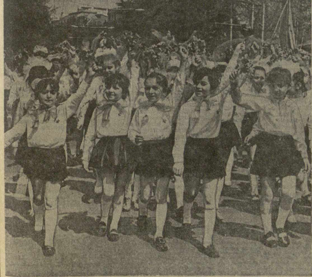
Празднование 1 Мая 1974 года в Тбилиси. Дети на демонстрации.