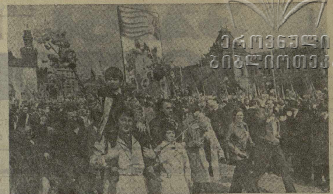
МОСКВА. Красная площадь. Празднование 1 Мая 1974 года в Москве. На снимке: демонстрация представителей трудящихся на Красной площади.

М. ГОРБАЧЕВА, А. КОЗЛОВ, В. КУЛИКОВ, А. СТРОГАНОВ, Е. ХОРЕВА.