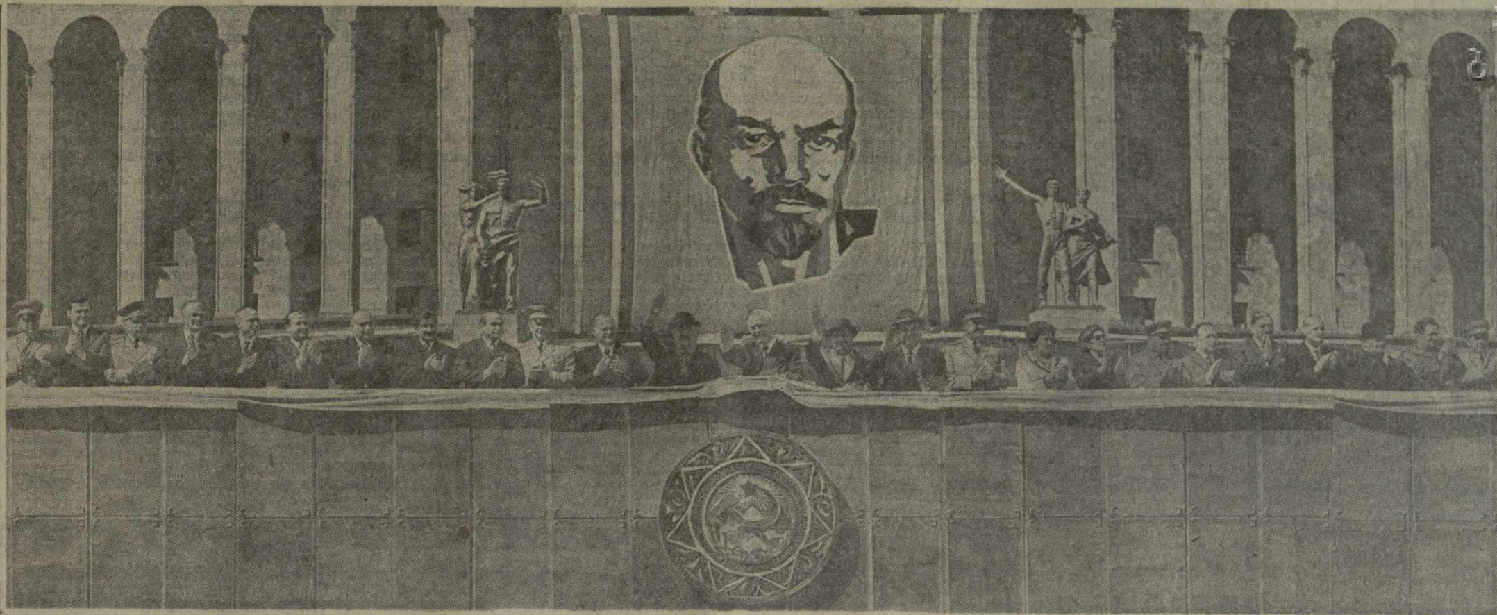
ТБИЛИСИ, 1 Мая 1974 года. На центральной трибуне.

Призыв партии — еще выше поднять знамя всенародного социалистического соревнования, самоотверженным ударным трудом обеспечить досрочное выполнение плановых заданий и социалистических обязательств в четвертом, определяющем году пятилетки вдохновляет ком уников, всех трудящихся Советской Грузии на беззаветный труд во имя Отчизны, на благо мира и социального прогресса. Это ярко проявилось на всем облике Первомайского праздника в столице республики.