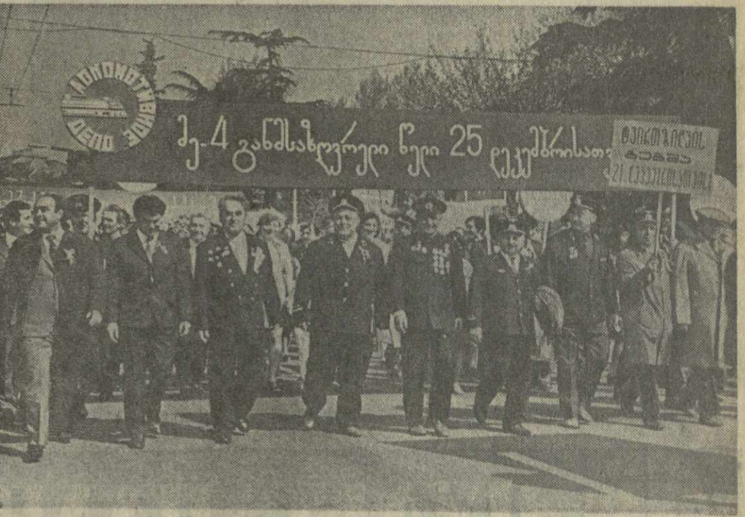
Идут праздничные колонны представителей трудящихся столицы республики.

алиста, в речи товарища Л. И. Брежнева на съезде, юности и деунии Грузии юности, в борьбе за выполнение исторических решений XXIV съезда КПСС. Для комсомола и молодежи нет более важной и ответственной задачи, чем активное участие во всенародном социалистическом соревновании за перевыполнение плана 1974 года, за успешное завершение пятилетки. Участники первомайской демонстрации пронесли над своими рядами портреты руководителей партии и правительства, лозунги, выражающие единодушную поддержку той борьбе, которую твердо и последовательно ведут наша партия, Совет-