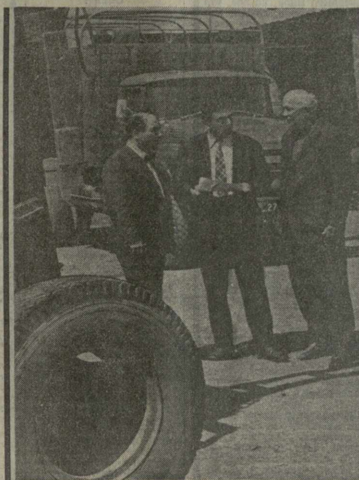
● ГДЕ ТОЛЬКО НИ ВСТРЕТИШЬ ГЕОЛОГОВ — ЭТИХ БЕСПОКОЯЩИХ ЛЮДЕЙ! Увидишь их в горах и долинах, на нехоженых тропках и у бурных рек. Ищут они золото и серебро, медь и свинец, нефть и газ...

Победителем Всесоюзного социалистического соревнова-