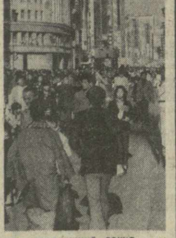
▲ СЕГОДНЯШНИЙ ТОНИО — столица Индии — представляет собой яркое сочетание старого и нового. В архитектурном, обычаях и традициях отражается прошлое и настоящее страны. Здесь всегда англоязычно, но особенно по воскресеньям, когда гонимая индусами автомобильная движется. На снимке так выглядит «Тонио».

БЕИРУТ, 16 мая. (ТАСС). Израильская авиация вновь нанесла вчера бомбовые удары по ливанской территории в районе населенного пункта Аль-Хариба. В этот же день израильская тяжелая артиллерия обстреляла район населенных пунктов Яфрон, Мимис, Ла-Накура, Илим аш-Шааб, Ярун, Битт Джубайль, расположенные