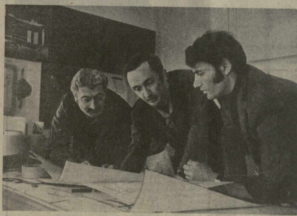
Награды кинофигурам. Коллегия Государственного комитета Совета Министров Грузинской ССР по кинематографии и президиум Грузинского республиканского комитета профсоюза работников культуры обсудили материалы социалистического соревнования коллективов учреждений кинофикации по итогам работы за первый квартал.