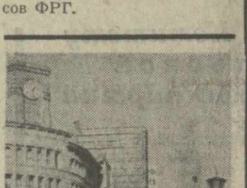
▲ СЕГОДНЯШНИЙ ТОНИО — столица Индии — представляет собой яркое сочетание старого и нового. В архитектурном, обычаях и традициях отражается прошлое и настоящее страны. Здесь всегда англоязычно, но особенно по воскресеньям, когда гонимая индусами автомобильная движется. На снимке так выглядит «Тонио».

БУЭНОС-АЙРЕС, 16 мая. (ТАСС). Палата депутатов федерального столичного округа приняла решение объявить главу чилийской военной хунты Персона нон грата. В принятой ею резолюции говорится, что визит в страну «личности, возглавляющей военную хунту, на совети которой тысячи убитых и замученных и которая путем насилия пытается покорить народ братской страны, не имеет ничего общего с чувствами и настроениями аргентинского народа». С подобными заявлениями выступили семь политических партий, ассоциация адвокатов и другие представители общественности. Так встречено здесь сообщение о том, что самолет с Пиночетом на борту следует техническую остановку в аргентинском аэропорту «Эсейса» при возвращении из Парагвая в Сантьяго. Время от времени военная хунта Чили, кровавые дела которой осудила вся мировая общественность, шлет гонимых за границу с целью «поднятия престижа» своего режима. Но эмиссары хунты, даже с дипломатическим рангом, презирают и отвергают.