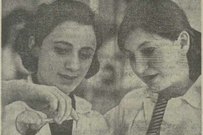
ГРУЗИНСКИЙ ОРДЕНА ТРУДОВОГО КРАСНОГО ЗНАМЕНИ СЕЛЬСКОХОЗЯЙСТВЕННЫЙ ИНСТИТУТ — одно из старейших учебных заведений в нашей республике. За годы своего существования институт выпустил десятки тысяч специалистов сельского хозяйства. С вводом в эксплуатацию нового учебного комплекса в Дигоми вырос уровень подготовки кадров, расширилась база учебно-опытного хозяйства. В СХИ наряду с педагогической деятельностью большое внимание уделяется научно-исследовательской работе.

Выяснилось, что несколько классов команд упомянутой школы требовали срочного ремонта, а средств для этого не имелось. По нашей просьбе Марнеульский районный отдел народного образования, изучив письмо учащихся, выделил необходимые средства для капитального ремонта здания. Он будет проведен в период летних каникул.