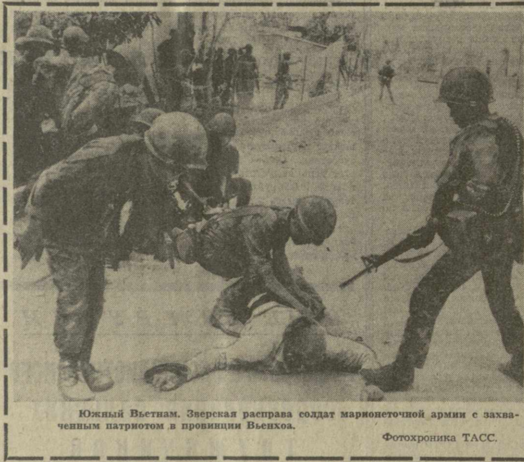
Южный Вьетнам. Зверская расправа солдат марионеточной армии с захваченным патриотом в провинции Вьетхоа.