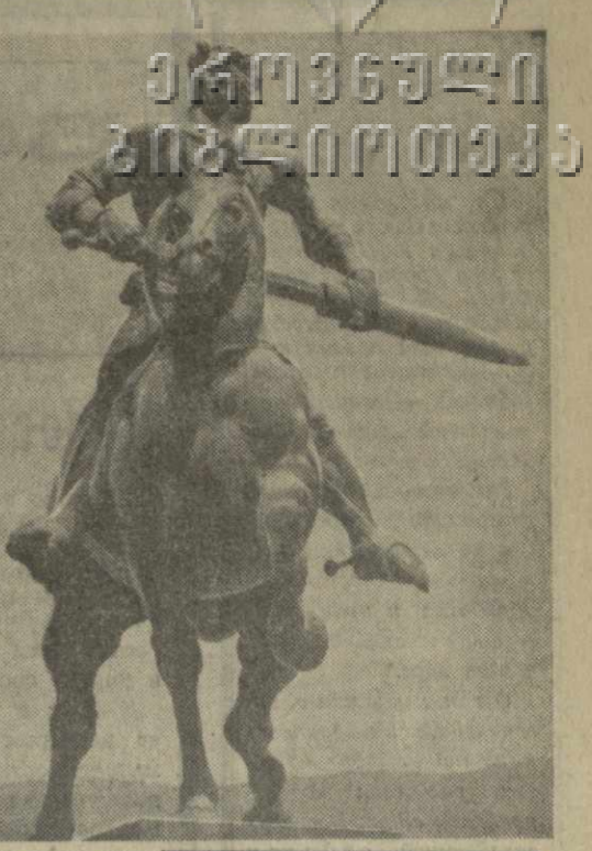
На снимке: памятник Георгию Саакадзе в Каспи.