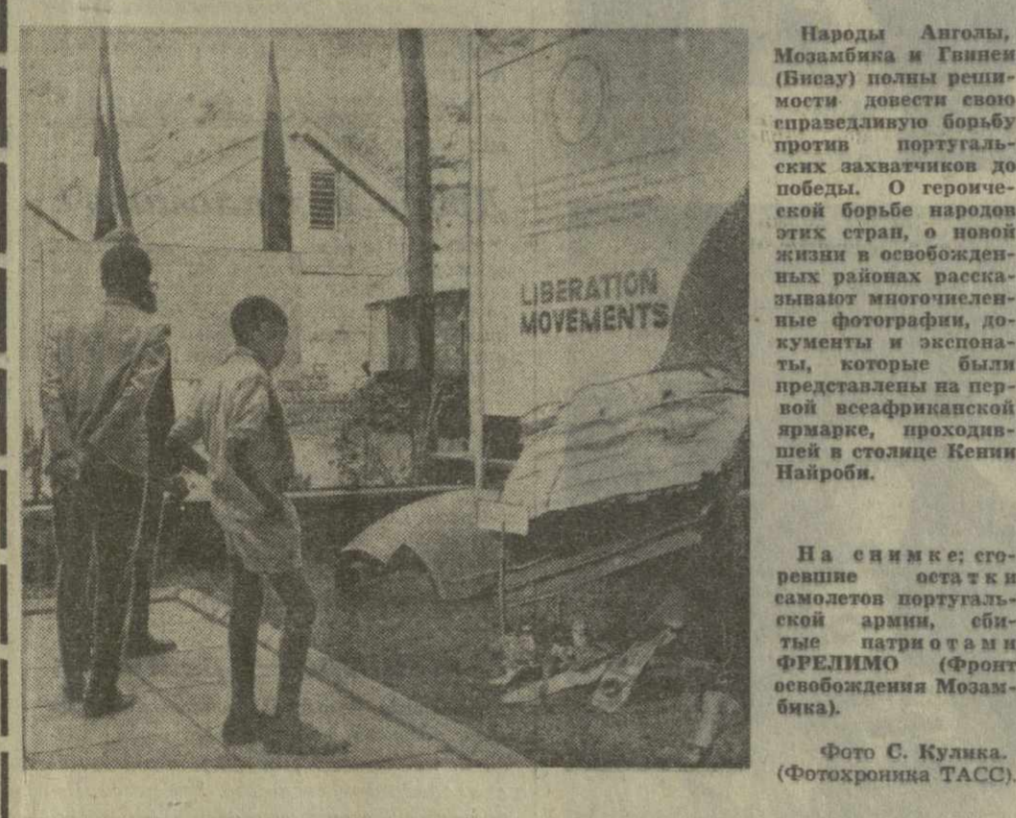
Народы Анголы, Мозамбика и Гвинеи (Бисау) полны решимости довести свою справедливую борьбу против португальских захватчиков до победы...