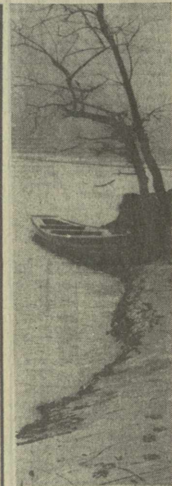
На берегу Курм. Фотохудож. Я. Гурепядзе. (Фотокроника ГрузИНФОРМА)