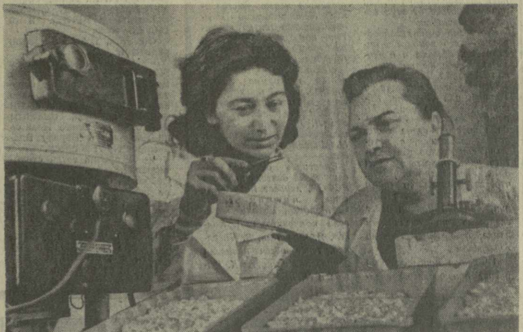
Очамчирская государственная семейная инспекция проводит вторичную проверку семейных фондов района, которые ныне составляют 2.700 центнеров кукурузы, 115 центнеров сои, 42 центнера фасоли.

На симпозиуме будет прочитано 64 доклада, многие из которых посвящены общим вопросам новой методики преподавания и применению технических средств при изучении самых различных наук. Такая встреча принесет несомненную пользу, так как широкое внедрение новой формы обучения в вузах страны требует, чтобы ученые находились в постоянном творческом контакте, обменивались мнениями по тем или иным вопросам, достижениями и приобретенным опытом. Необходимо постоянно координировать свою деятельность, быть в курсе того, что делается в этом направлении в других вузах страны. Тбилисский симпозиум во многом будет способствовать выполнению этих задач.