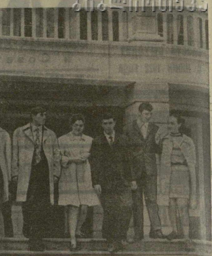
Группа участников открытого собрания комсомольской организации колхоза имени В. И. Ленина села Натанеби Махарадзевского района у Дворца культуры.

Большие и серьезные задачи стоят сейчас перед комсомольской организацией и ее членами, как и перед всеми комсомольскими организациями республики. Эти задачи определены историческими решениями XXIV съезда КПСС, в которых вновь подчеркнута роль комсомола как верного помощника и боевого резерва Коммунистической партии. Об этих задачах говорится также в Постановлении ЦК КПСС «Об организаторской и политиче-