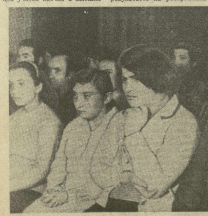
На комсомольском собрании.

Недавно от обязанностей президента Академии наук Грузии освобожден по личной просьбе академик Николай Иванович Мухелишвили, бесценно возглавлявший нашу Академию со дня ее основания, вот уже на протяжении более тридцати лет. Президентом Академии наук республики избран выдающийся ученый-математик академик И. Н. Веква. Однако, учитывая большие заслуги огромную роль в становлении и развитии грузинской советской науки, общее собрание Академии наук Грузинской ССР избрало его почетным президентом Академии.