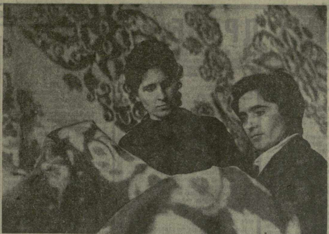
Коллектив Кутанской суконной фабрики имени В. И. Ленина успешно несет трудовую вахту в честь 50-летия образования СССР. План четырех месяцев второго года девяти пятiletия перепланирован. Фабрика выпустила шерстяные и полушерстяные одеяла, отгружаемые во все уголки нашей страны. Жанкардовые одеяла из чистой шерсти были представлены на получение Знака качества.