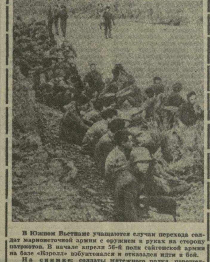
В Южном Вьетнаме учащаются случаи перехода солдат маршистов к партизанам.