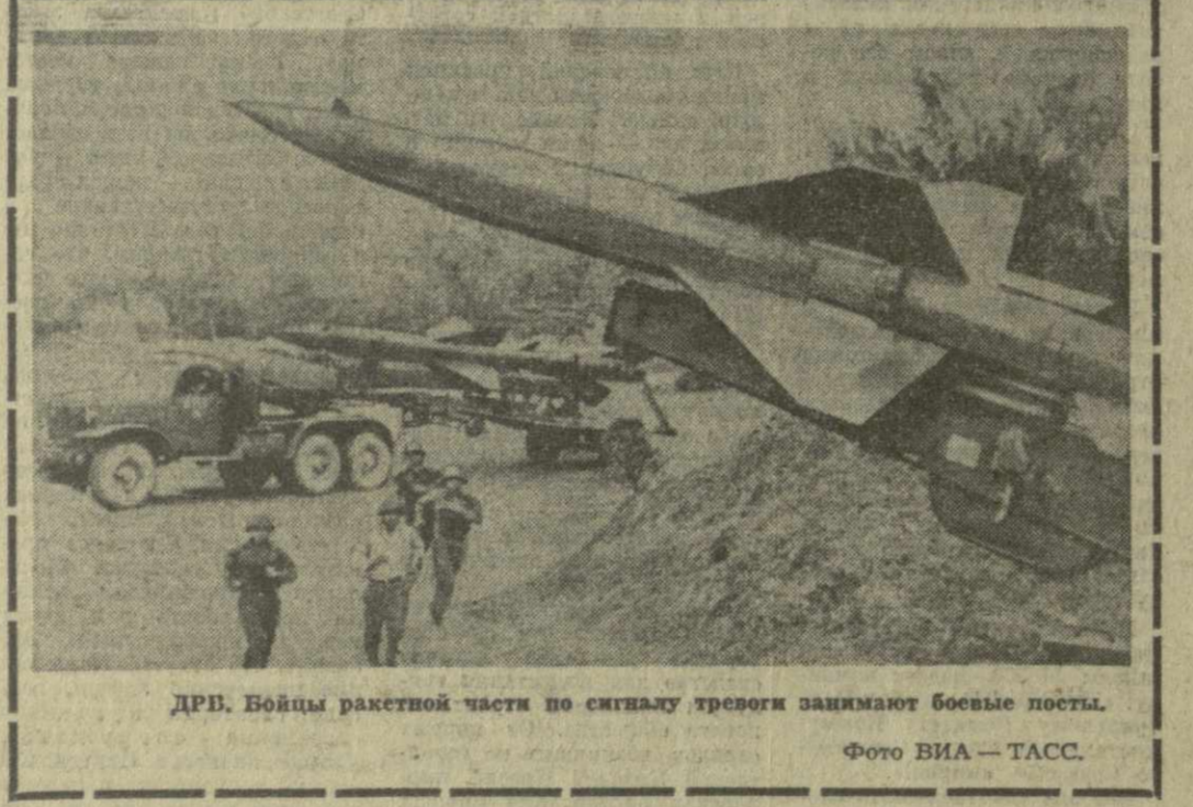
ФРВ. Бойцы ракетной части по сигналу тревоги занимают боевые посты.

Участники торжественного пионерского сбора скандируют: «Слава Коммунистической партии!», «Слава советскому