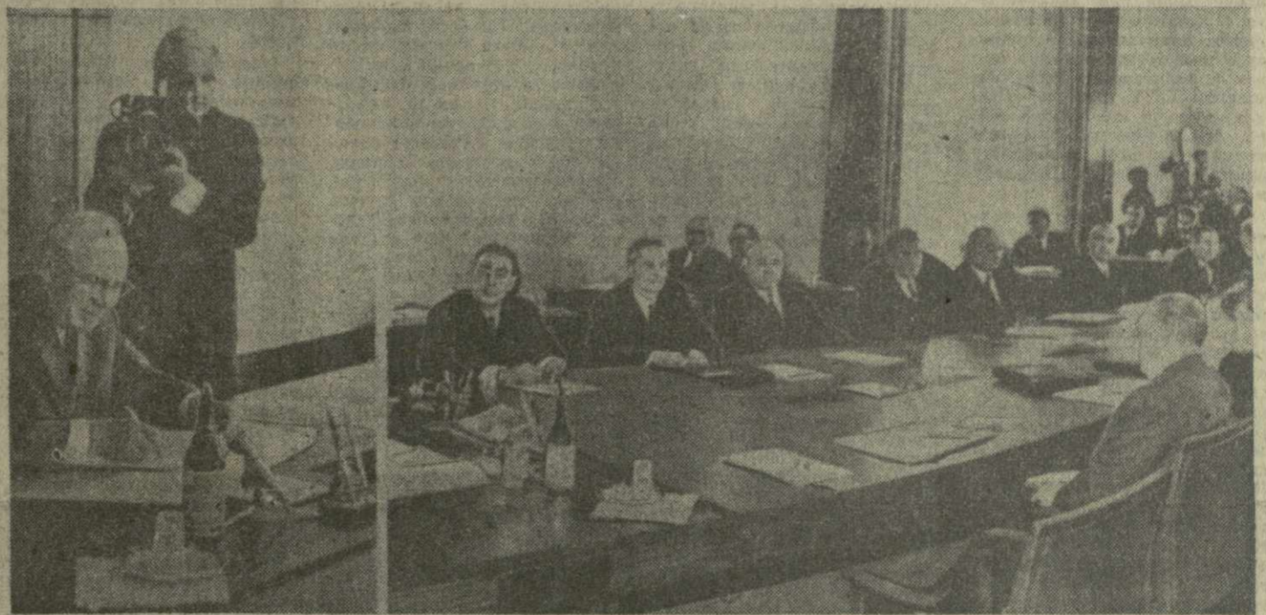
Москва, Кремль, 31 мая. Заседание Президиума Верховного Совета СССР. Указ Президиума Верховного Совета СССР о ратификации Договора между СССР и ФРГ подписывает Председатель Президиума Верховного Совета СССР Н. В. Подгорный.