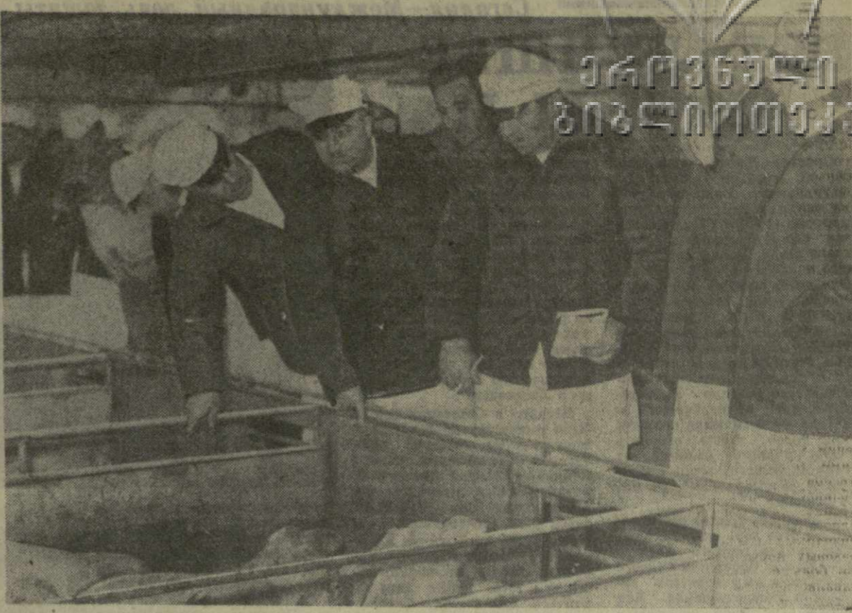
На снимке: специалисты сельского хозяйства Грузии осматривают один из участков свиноводческой племенной и откормочной базы в Эберсвальде.

В ГДР весьма ограничены перспективы развития овцеводства. Общие их поголовье достигает 1.600.000. Поэтому здесь решено перевести овец на стационарное