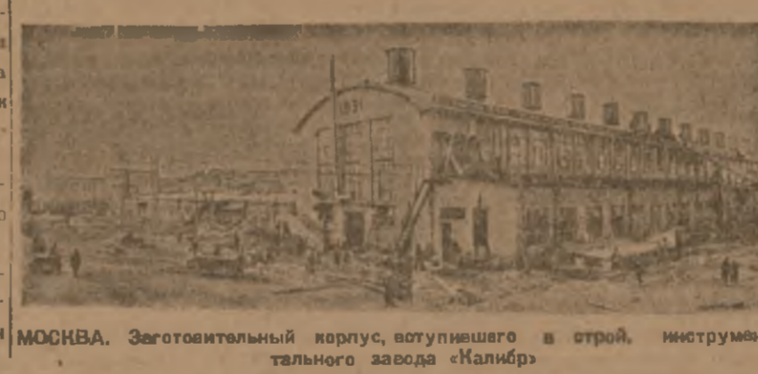
МОСКВА. Заготовительный корпус, вступившего в строй, инструментального завода „Калибр“.

20 июля, в 2 часа дня, редакция „Зари Востока“ совместно с представителями всесоюзного нормового штаба и „Известий“ объявляет совещание по проведению буденовского похода за ноня и норма.