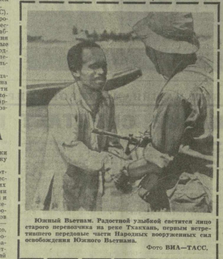
Южный Вьетнам. Радостной улыбкой светится лицо старого переселенца на реке Тханкхан, первым встретившего передовые части Народных вооруженных сил освобождения Южного Вьетнама.