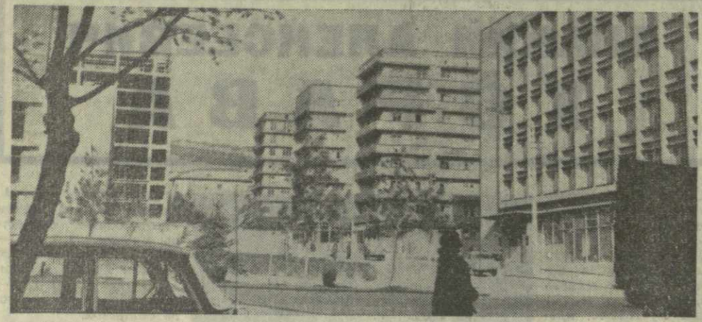
Новь древнего Тбилиси. Уголок проспекта Важа Пшавела.