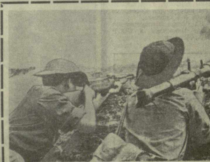
Патриоты НВСО Южного Вьетнама усиливают натиск на противника. Только за одну неделю в провинции Контум было выведено из строя 800 вражеских солдат. На снимке: бойцы НВСО ведут огонь по укрытиям противника.

«Общего рынка» будут сегодня закрыты в связи с создавшимся критическим положением. Серьезное беспокойство вызвало решение правительства Англи во французских финансовых и экономических кругах. Стояло специальное заседание с участием президента Ж. Помпиду, премьер-министра Ж. Шабан-Дельмаса и министра экономики и финансов В. Жискара д'Эстеза для обсуждения создавшегося положения. После заседания Жискара д'Эстеза заявил, что соглашение о сокращении пределов колебаний курса фунта, подписанное между шестью странами — членами ЕЭС, отныне прекращает свое действие в отношении фунта стерлингов. Агентство Франс Пресс отмечает, что решение Англи представляет собой новое подтверждение того, что западная валютно-финансовая система практически вышла из строя. Сегодня Г. Киссинджер отбыл в Вашингтон.