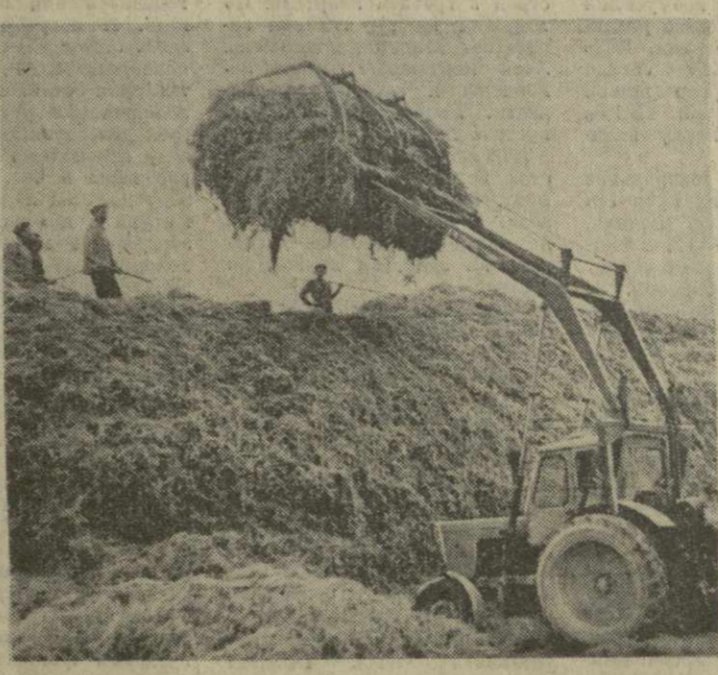
В Алванском животноводческом совхозе горячая пора — идет заготовка кормов. Большой объем работ выполняется с помощью техники.

С большим подъемом несут трудовую вахту в честь 50-летия образования СССР горняки Чхатура. Коллектив рудоуправления им. Орджоникидзе успешно завершил первое полугодие.