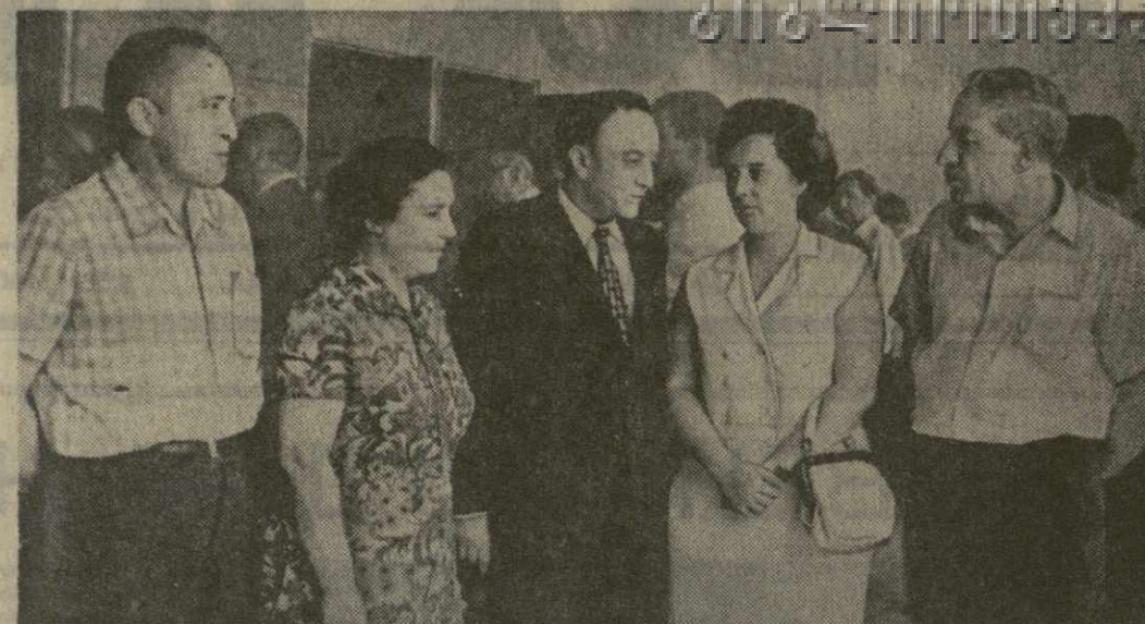
На снимке: группа участников городской научно-практической конференции.

лиси. Подготовка к 50-летию образования Союза ССР широко используются для дальнейшего улучшения всей идеологической работы, мобилизации трудящихся на претворение в жизнь решений XXIV съезда КПСС, развертывание социалистического соревнования за досрочное выполнение планов девяти пятилетки. Партийные организации активно борются за устранение недостатков, отмеченных в постановлении ЦК КПСС «Об организаторской и политической работе Тбилисского горкома Компартии Грузии по выполнению решений XXIV съезда КПСС». Ниже публикуются материалы о некоторых вопросах, обсуждавшихся на конференции.