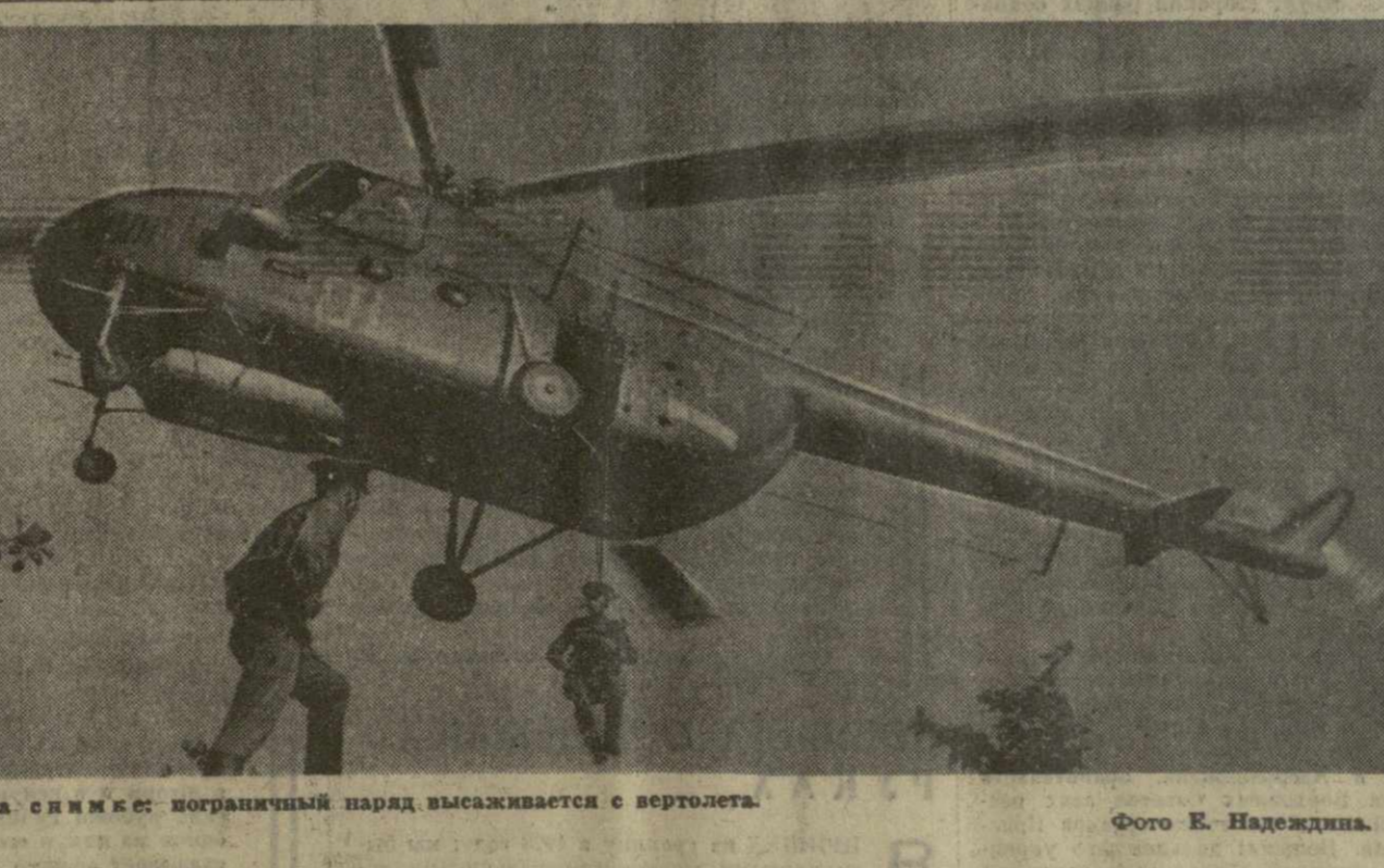
На снимке: пограничный парад высаживается с вертолета.

гачев, первый заместитель председателя Государственного комитета Совета Министров СССР по внешним экономическим связям И. В. Архипов и другие официальные лица. На летном поле был выстроен почетный караул войск Московского гарнизона. Начальник почетного караула одал рапорт Премьер-Министру АРЕ. Прозвучала государственные гимны двух дружественных стран.