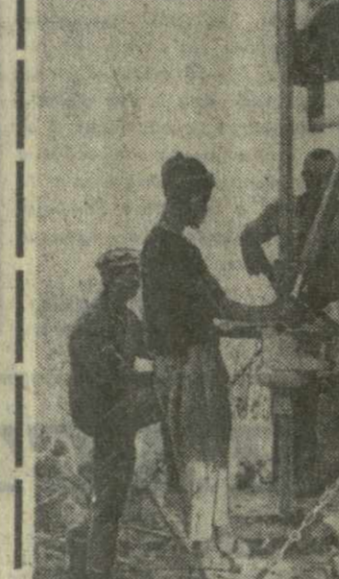
По просьбе правительства Сенегала и в соответствии с договором об экономическом сотрудничестве...