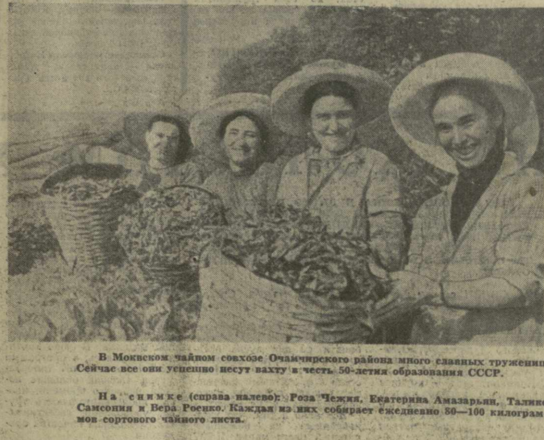
В Московском чайном совхозе Очамчирского района много славных труженников. Сейчас все они успешно несут вахту в честь 50-летия образования СССР.