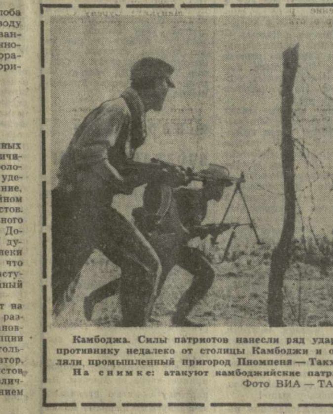
Камбоджа. Силы патриотов нанесли ряд ударов по противнику недалеко от столицы Камбоджи и отбросили промышленный пригород Пномпеня — Такмау. На снимке: атакуют камбоджийские патриоты.

БЕЛГРАД, 18 июля. (ТАСС). Газета «Борба» опубликовала статью С. Вуцич, посвященную вопросам идеологического единства в Союзе коммунистов Югославии. В статье говорится: «Если в Союзе коммунистов право граждан получают различные платформы, если существуют различные идеологии — а такое положение наблюдается в настоящее время, — то невозможно добиться дееспособности, эффективности действий Союзу коммунистов. Чтобы добиться этого цели, необходимо прежде всего единство взглядов по основным вопросам общественного развития». Эта мысль часто присутствует в последние время при обсуждении вопросов о реорганизации Союза коммуни-