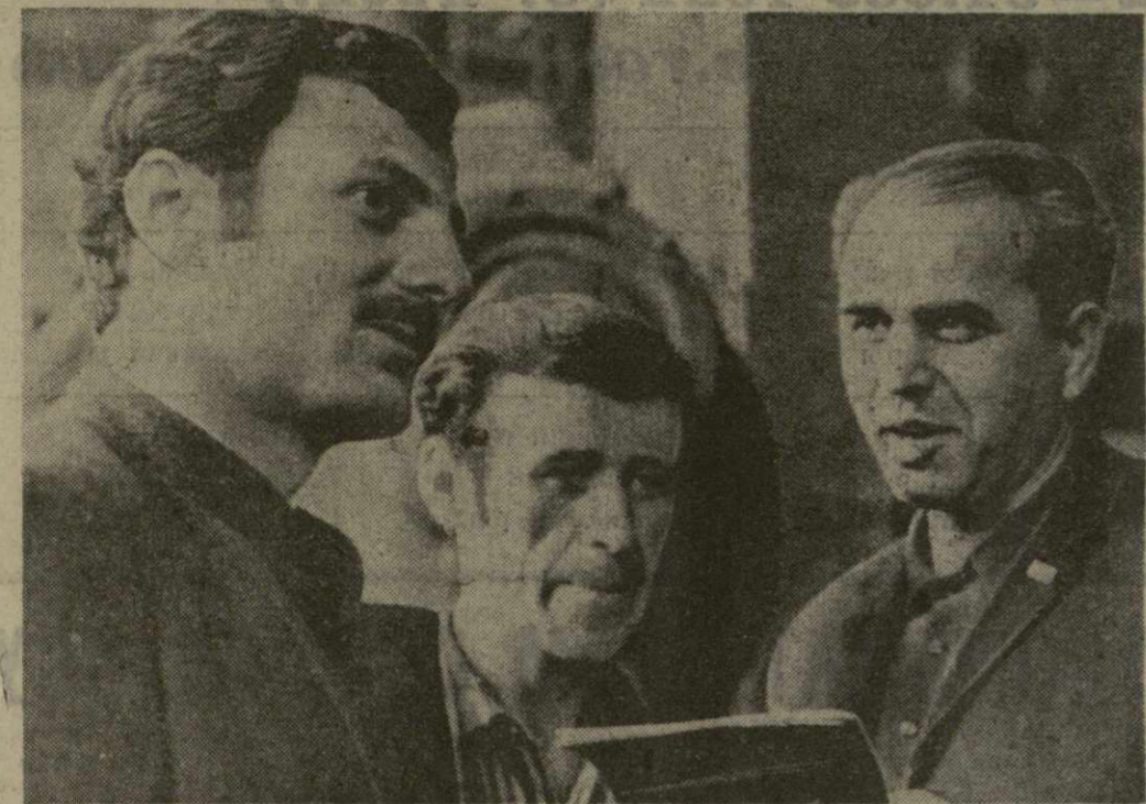
Успешно несет трудовую вахту в честь 50-летия образования Союза ССР коллектив штамповочного цеха Тбилисского электрооборудованного завода имени В. И. Ленина.

Успешно несет трудовую вахту юбилейного года коллектив руставских мастерских электротехнических заготовок ордена Ленина треста № 1 «Закавказметаллургстрой». С превышением реализована полугодная производственная программа. Изделия этого предприятия отличаются высоким качеством и надежностью в эксплуатации. Вот почему заказы на них размещают в Рустави не только строительные организации Грузии, но и братских республик Азербайджана и Армении.