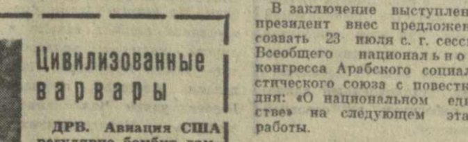
ДРВ. Авиация США регулярно бомбит дамбы и плотины Северного Вьетнама, разрушая то, что было создано на протяжении десятилетий. В период сезона дождей потоки воды, не встречая преград, должны будут обрушиться на рисовые поля, деревни, ссылаясь все на своем пути.