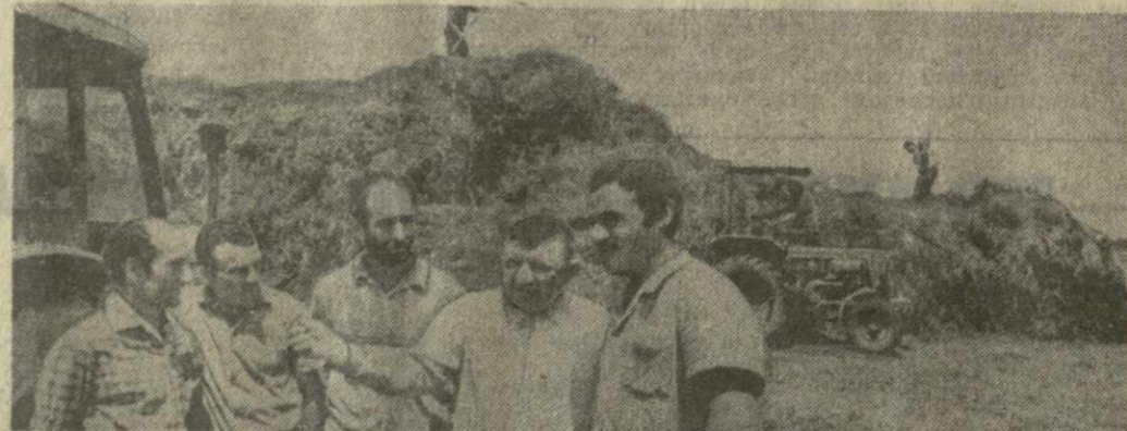
Слово и дело кукурузоводов

Заслуга бригады в том, что совхоз досрочно и с превышением реализовал полу-